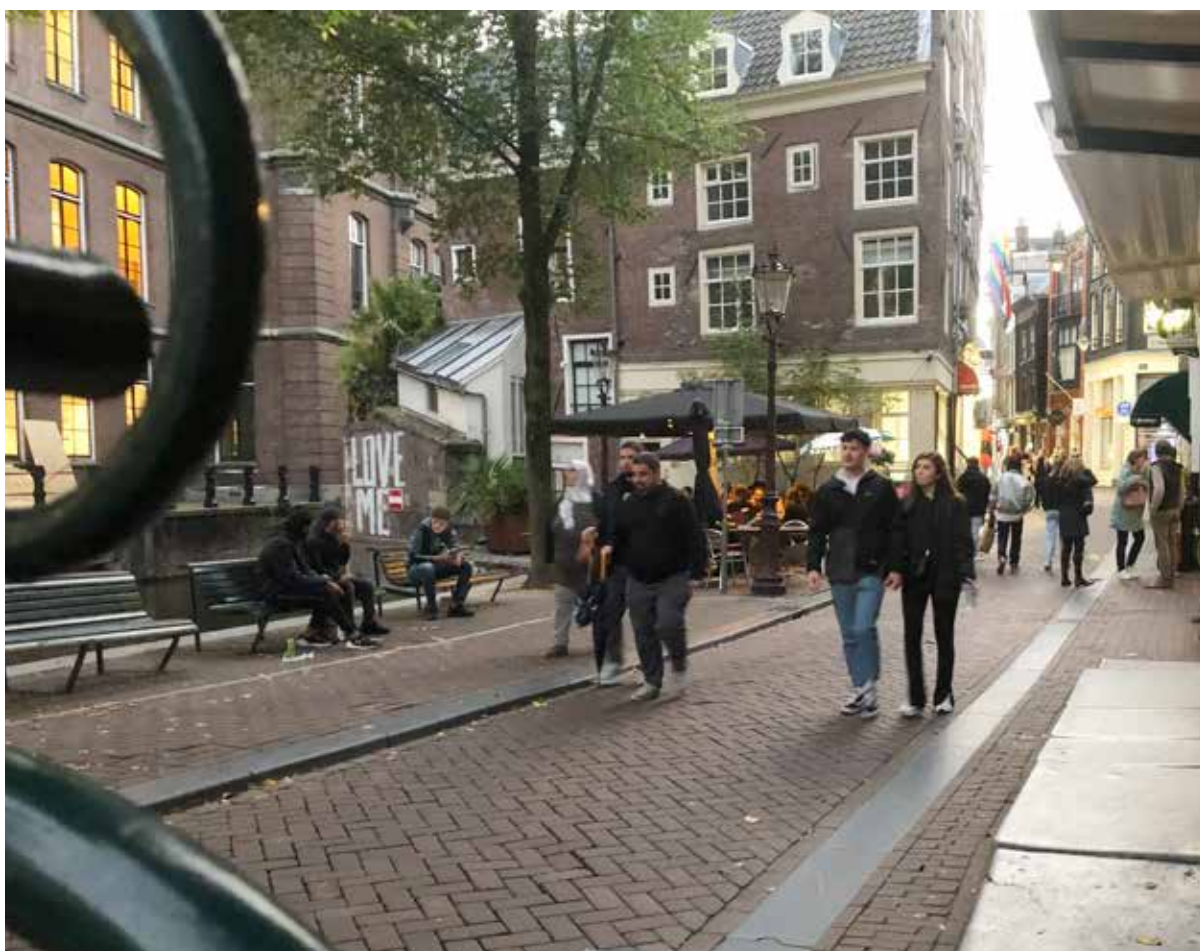
Steeds meer last van dealers en hangjongeren bij de Grimburgwal

'Het is dweilen met de kraan open', zegt Van Buren. 'Hier in ons café-restaurant en op het terras in het Gebed zonder End hebben we nog nooit zoveel last gehad van dealers en die lastige gasten. We proberen ze uit alle macht te weren uit onze zaak en uit de steeg.'