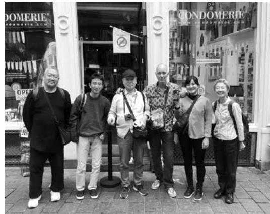
Op bezoek bij de Condomerie

Hiertegenover stonden contrasterende ervaringen zoals een bezoek aan Ons' Lieve Heer op Solder, het fraaie grachtenpand aan de Oudezijds Voorburgwal 136, versholten rustgevende binnentuinen en The Bulldog Hotel.