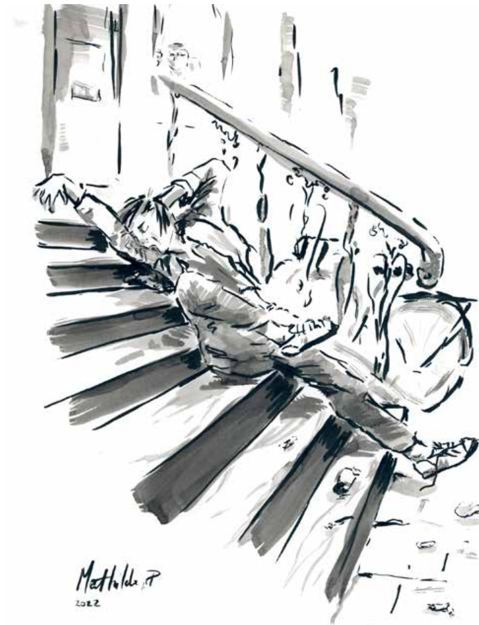
'Alsof hij door een engel uit de hemel op aarde is gesmakt'

Wil meneer bij zijn koffie misschien ook nog het warm gestreken ochtendblad? Het is amusant, maar ik ben ook gerustgesteld, want hij reageert adequaat en dat is hoopvol. Ik zet een kopje koffie met extra melk zodat het niet te heet is, roer er extra suiker in voor de energie en loop weer naar beneden. Het kopje zet ik wat verder weg zo-