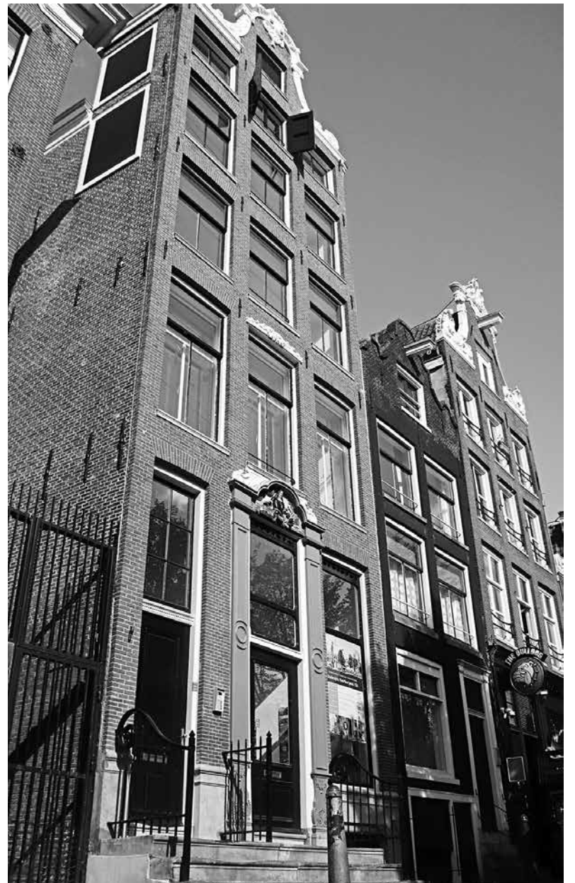
Het huis met Cornelis Tromp boven de deur