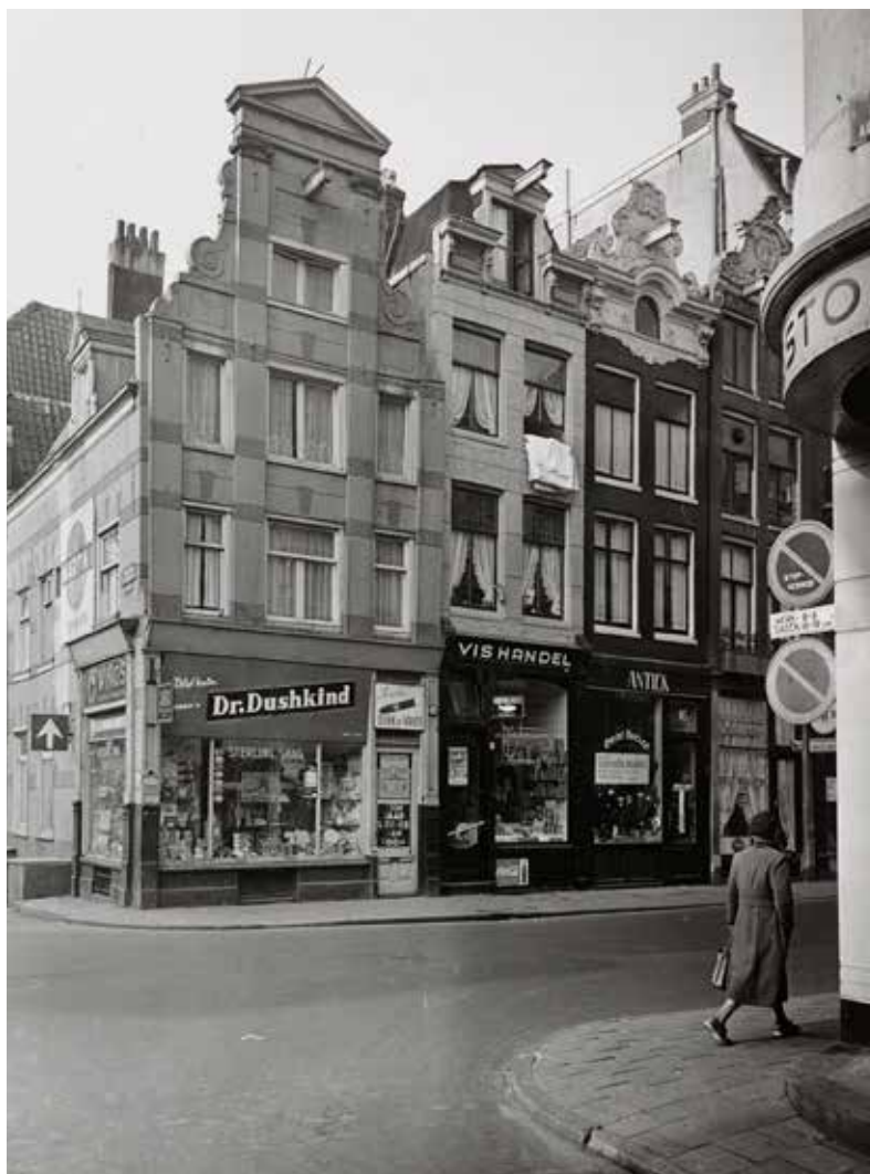
De sigarenzaak en 't Haringhuis in 1956

Met zijn sleutel opende hij toen de deur. In den winkel vond hij niets verdachts, maar in de kamer direct achter den winkel trof hem een ontzettend