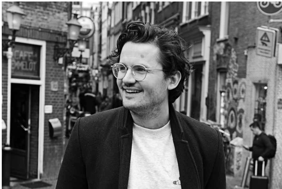
'De Amsterdammer moet het straatbeeld weer gaan bepalen'

We moeten het aantal toeristen verminderen. Er zijn te veel hotels. En we moeten de fraude met vakantieverblijf aanpakken. Nog altijd zien we dat verhuurders via allerlei platformen hele woningen aanbieden. Buitenlandse auto's kunnen we weren uit de binnenstad. Maak een Park&Ride buiten de