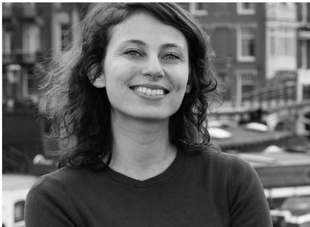
'Het invoeren van statiegeld zou lokaal kunnen worden uitgebreid'

Er moeten meer winkels en bedrijven komen die ook voor bewoners relevant zijn, vindt Oostra. 'Die moeten in de