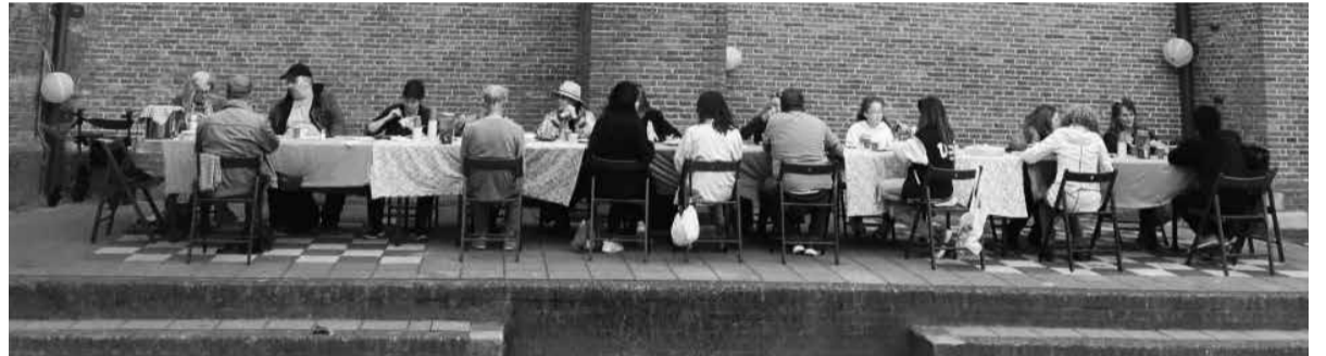
Samen eten als Het Laatste Avondmaal

Iedereen is welkom bij het Buurtrestaurant bij de Zuiderkerk; aanmelding is noodzakelijk. Voor meer informatie gvdhurk@dock.nl en/of maria.martinez@permens.nl