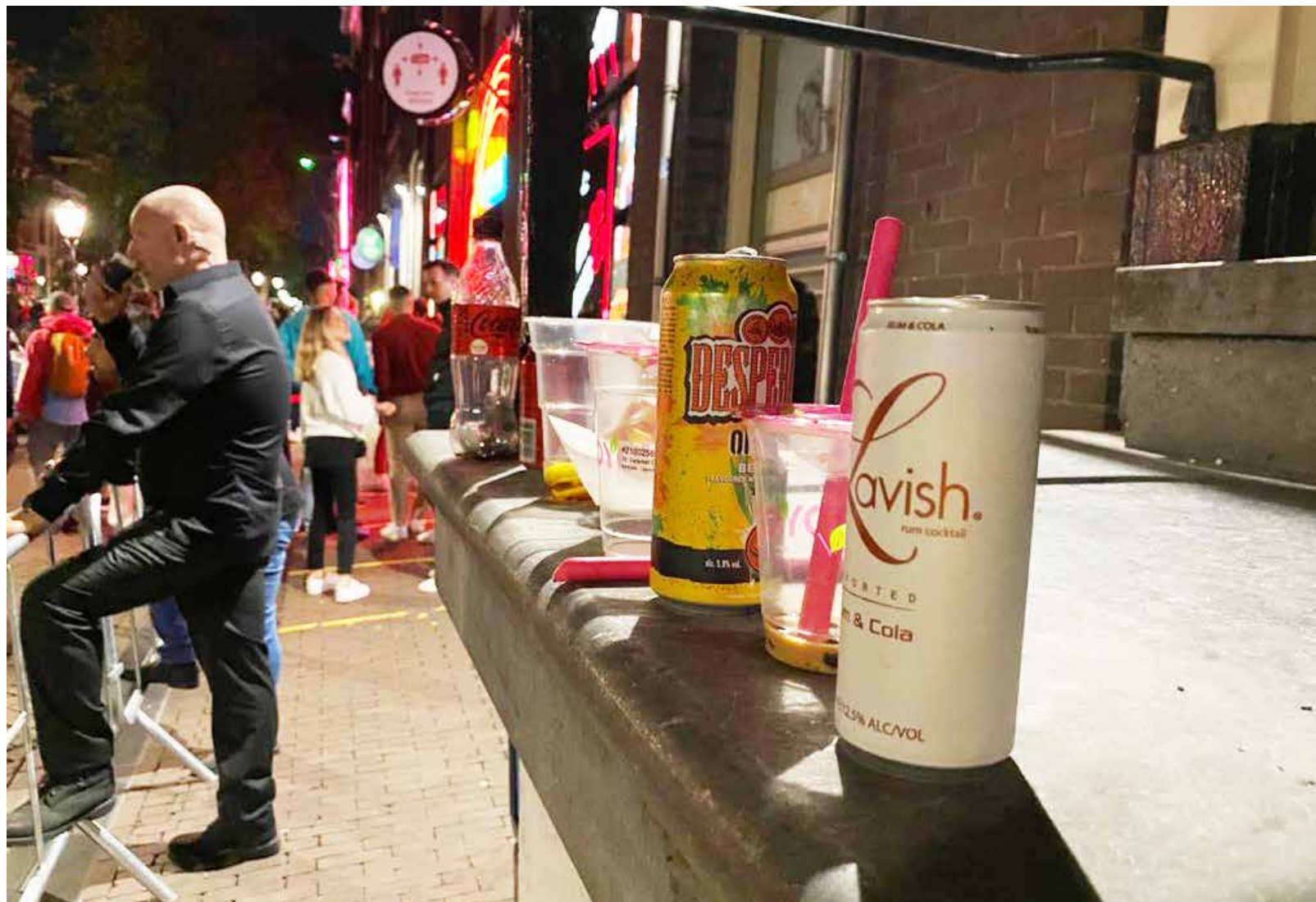
De Wallen zijn een van alcohol doordrenkt feestterrein

Om overlast door overmatig alcoholgebruik te voorkomen, mag in het centrum na tien uur 's avonds geen drank meer worden verkocht buiten cafés en terrassen. Hoewel handhaving het zou moeten verhinderen, gaat de verkoop in minisupermarkten en snackbars gewoon door. Met een trucje weliswaar. De klant krijgt zijn of haar blikje bier mee in een papieren zakje en de waarschuwing om niet al te openlijk te drinken als ergens een geel hesje te zien is. Ook wijnflessen gaan zo de papieren zak in. En wie nog sterkere drank koopt om op straat te feesten, koopt daar bij-