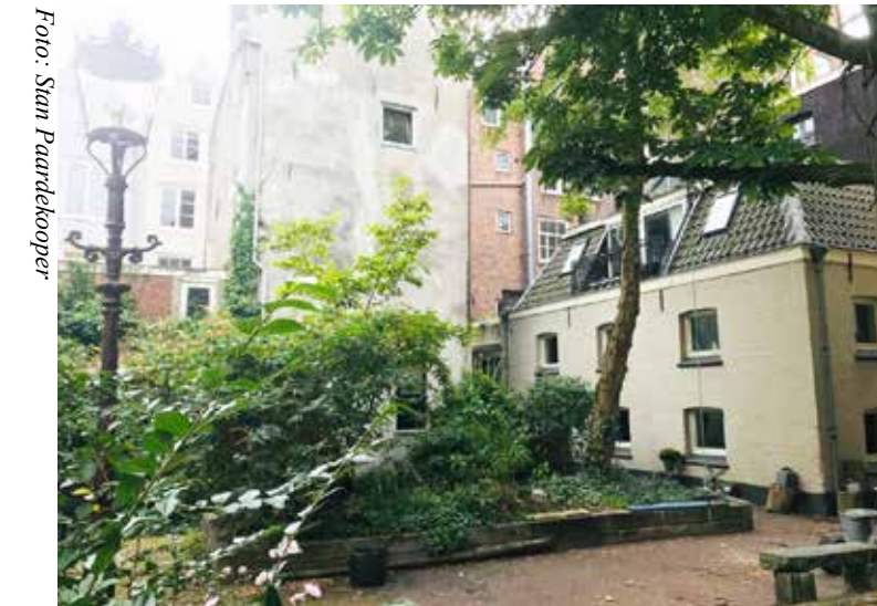
Een oase van stilte in het hart van het Burgwallengebied

Paardekooper en Jochems zijn al bijna dertig jaar buurtbewoners en zorgen ervoor dat het er schoon en uitbundig groen is. Toen de zandbak in onbruik was geraakt, werd deze met steun van het stadsdeel omgetoverd tot een weelderig bloemenperk. Er staan weliswaar veel fietsen geparkeerd, maar die vallen nauwelijks op tussen alle bloeiende planten en struiken.