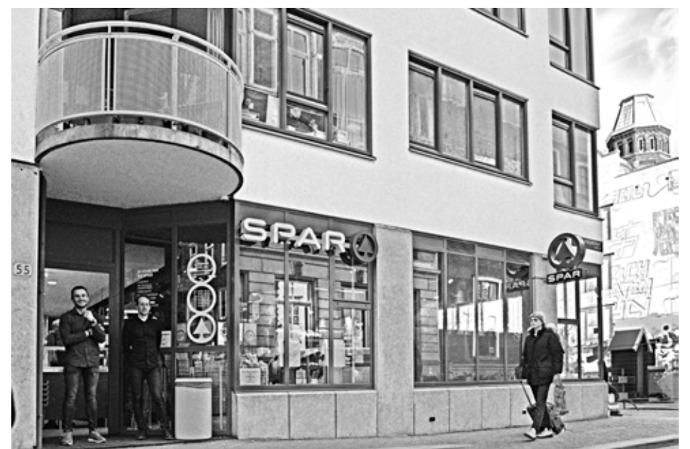
Aardappelen, groenten, vlees ... en stroopwafels

Ja, deze snelsuper is misschien niet direct die enorme verrijking waarvoor buurtbewoners meteen zullen omlopen. Zij zijn met reden verbitterd over het schrale winkelaanbod. Maar de eigenaar van de winkel is prettig behulpzaam en je komt thuis met de voedzame maaltijd waarvoor je de deur uitging. Spar City verdient het voordeel van de twijfel.