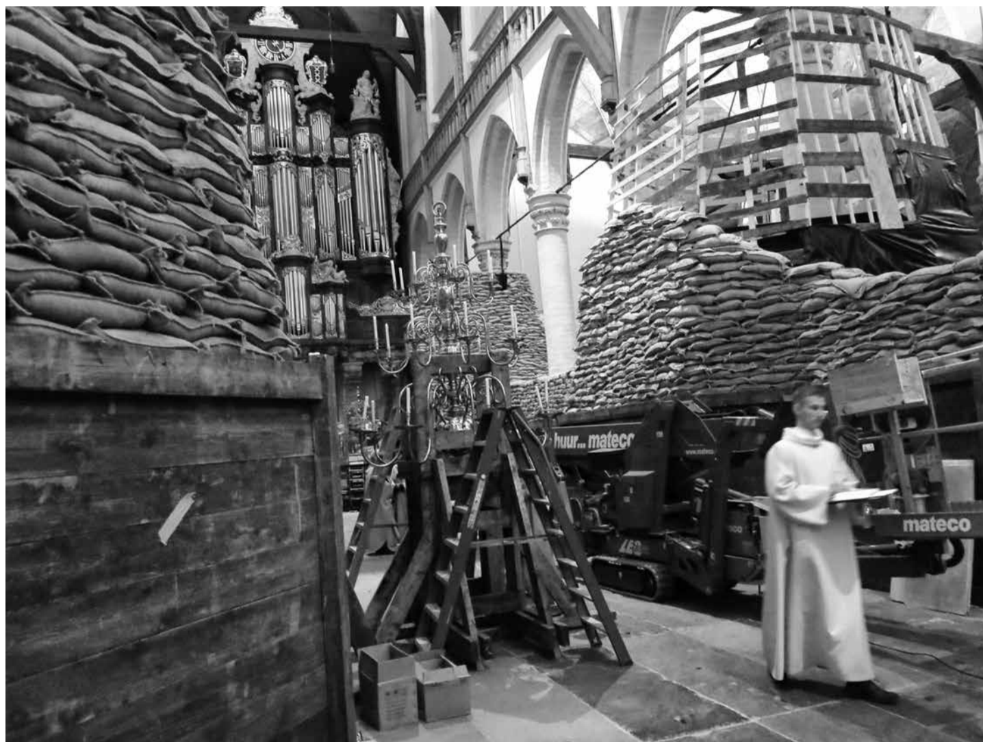
De kerkgemeenschap zingt achter de zandzakken

Daarmee begon het verslappen van de banden