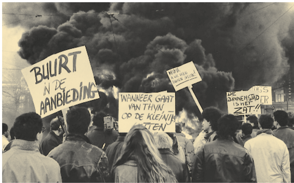
25 februari 1989, verzet tegen de drugsoverlast