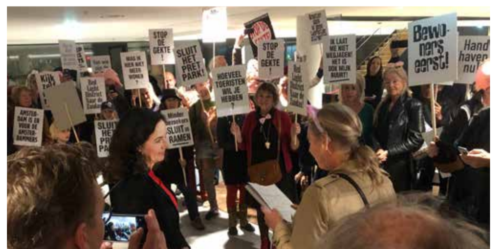
Op 17 oktober 2019 boden boze buurtbewoners burgemeester Halsema een petitie aan met meer dan 1200 reacties van verontruste Amsterdammers. Zij zijn de toerismedrukte beu en willen dat het stadsbestuur ingrijpt.