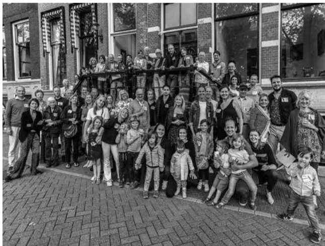
Op het bordes van Oudezijds Voorburgwal 219-221

Na een mooie zomer blijkt september de maand bij uitstek om een buurtborrel te organiseren en hier vakantie verhalen, nieuwtjes en plannen uit te wisselen onder het genot van een hapje en een drankje.