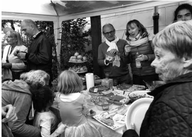
Kennismaken in de Koestraat

Bewoners van de Grimburgwal, Oudezijds Voorburgwal, Sint Agnietenstraat en Oudezijds Achterburgwal organiseerden op zondag 1 september voor de tweede maal een buurtborrel. Hotel The Grand verzorgde heerlijke borrelhapen. De bewoners zetten zich samen in voor de succesvolle avond. Fotograaf Wim Ruigrok vereeuwigde de aanwezigen op een bordes van de Oudezijds Voorburgwal.