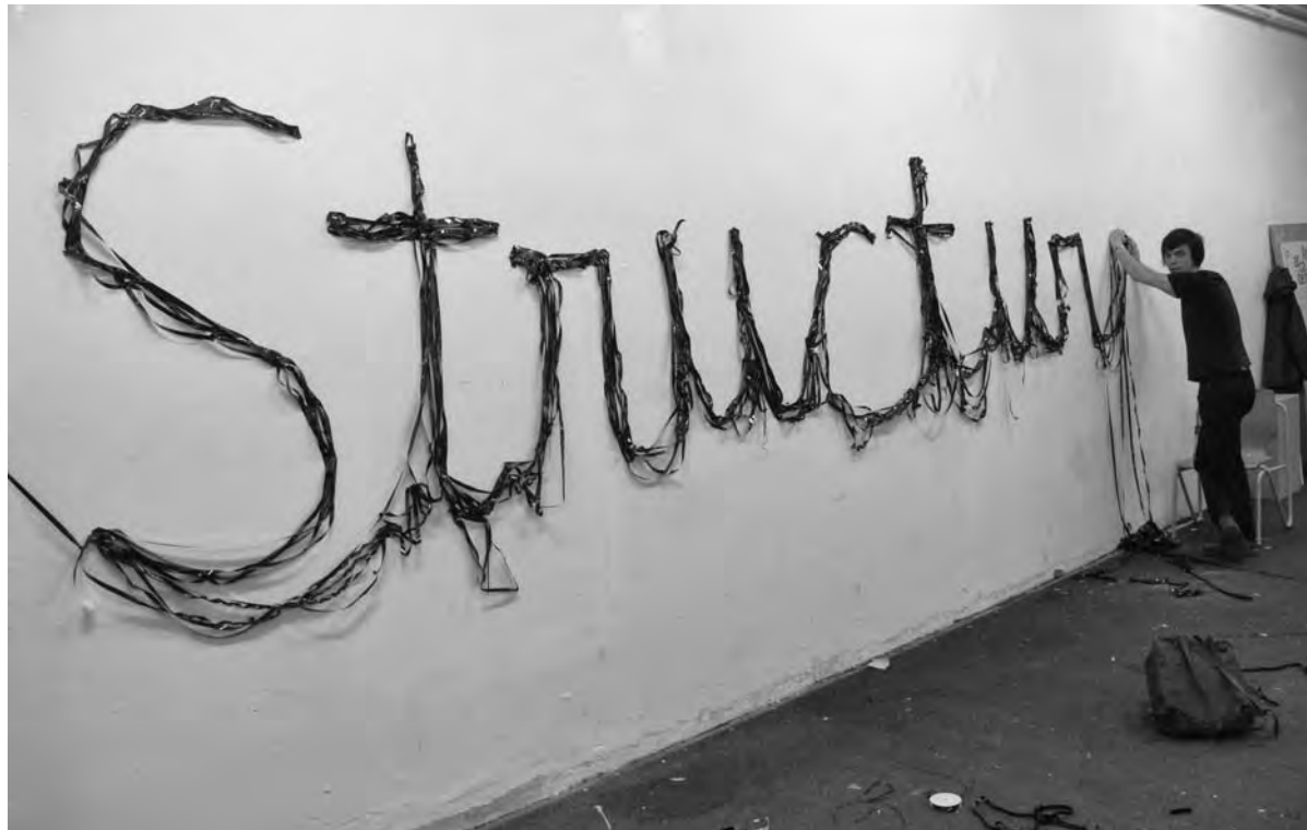
Structuur aanbrengen is een kunst (galerie W139)

De stadsdeelbesturen in hun huidige vorm zullen verdwijnen. Dat lot wacht dus ook het politieke bestuur van Amsterdam Centrum. Waarom eigenlijk? Wat komt hiervoor in de plaats? En gaan de burgers er daarmee op vooruit of achteruit? Tot nu toe zijn de landelijke discussies hierover helaas over hun hoofden heen gevoerd. Ze zijn het spoor dan ook bijster.