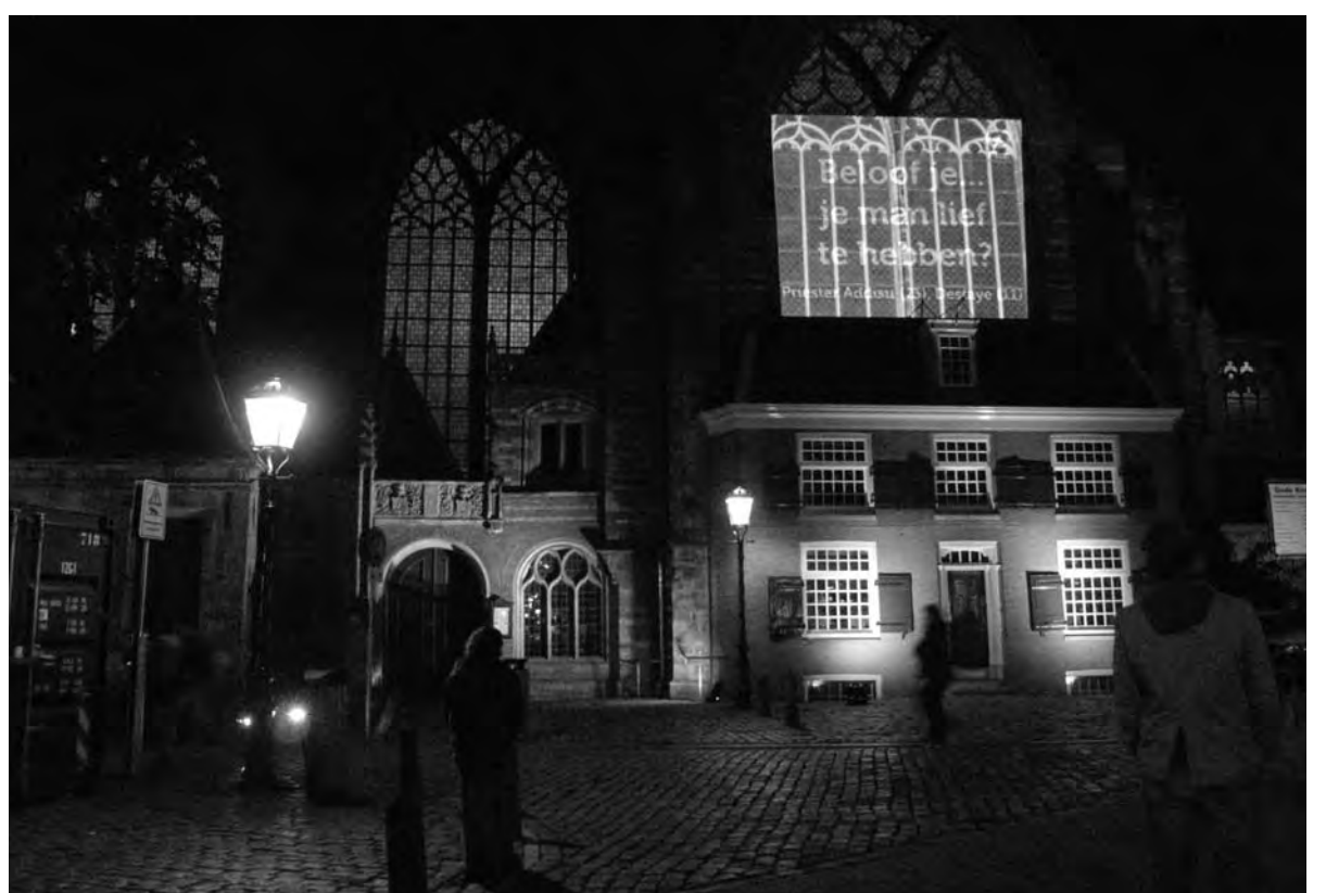
Pop-up projectie voor Plan Nederland

De Oude Kerk zelf heeft een prominente plaats in de geschiedenis van Amsterdam en leent zich bij uitstek voor concerten, bijvoorbeeld van muziek van de hand van Sweelinck, die er immers organist was. De kerk en het plein hebben veel te bieden aan een publiek dat op zoek is naar cultuur en de historie van het gebied. Ze zouden zich meer moeten profileren, zonder aansluiting te zoeken bij het niveau van seks, drugs en rock-'n-roll. Daar heeft de buurt al meer dan genoeg van.