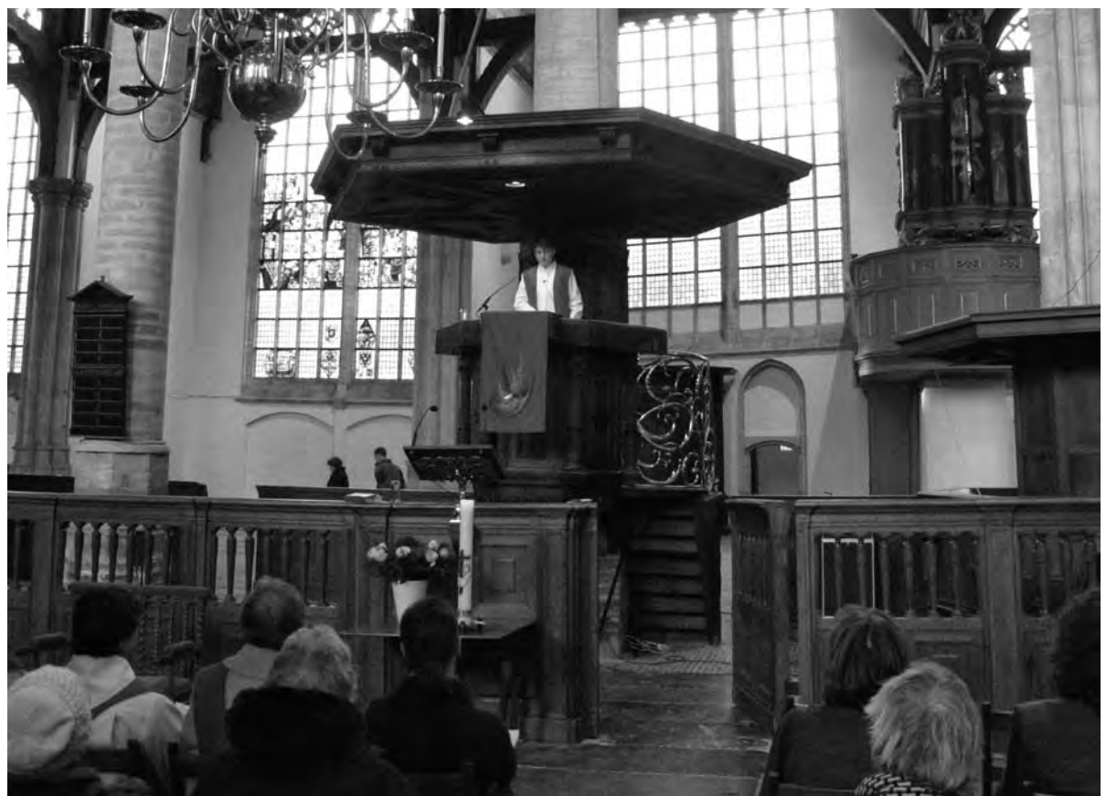
Rosaliene Israël in de Oude Kerk

website: www.oudezijds100.nl e-mail: info@oudezijds100.nl twitter: @Oudezijds100