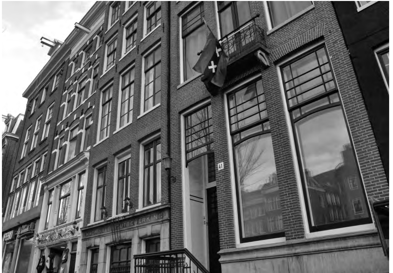
Veel appartementen in postcode gebied 1012 worden illegaal verhuurd

Veel van het ontijdig aangeboden afval is afkomstig uit de hotelappartementen, omdat toeristen geen flauw idee heb-