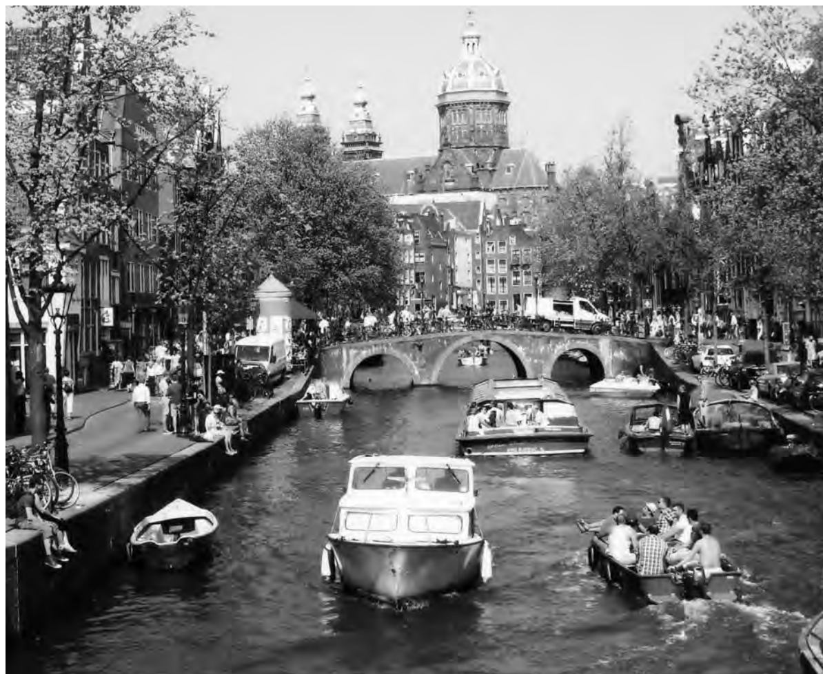
Ook hier is handhaving noodzakelijk

Toch zijn er na nauwkeurige lezing genoeg feiten in het rapport te vinden die aanleiding geven tot ongerustheid. Allereerst zegt het rapport 'dat er alle reden is voor zorg omtrent de handel in vastgoed'. Uit een onderzoek blijkt dat er jaarlijks in Nederland naar schatting voor 18,5 miljard euro wordt witgewassen en dat vastgoed één van de belangrijkste kanalen is waarlangs dit gebeurt. 'Er moet dus serieus rekening mee worden gehouden dat dit ook in de binnen-