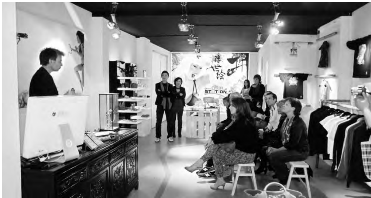
Het allerlaatste op het gebied van Aziatisch design

Asia Station zit op Geldersekade 100 en is ook te vinden op Facebook en Twitter (@Asia Station).