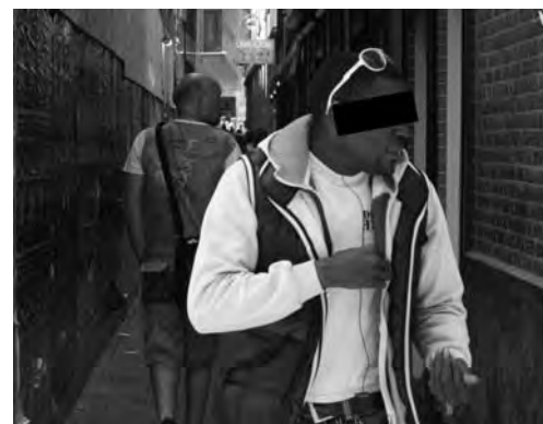
Er wordt openlijk gehandeld

Wat kan de politie doen tegen de nepdopedealers? Oppakken op grond van overtreding van de Opiumwet is onmogelijk, omdat er immers geen opium of aanverwante drugs worden verhandeld. Wel is er een algemene plaatselijke verordening (APV) op grond waarvan de Wallen zijn aangewezen tot dealeroverlastgebied (dog). Op grond van deze APV kan de aangehouden dealer de eerste keer voor drie