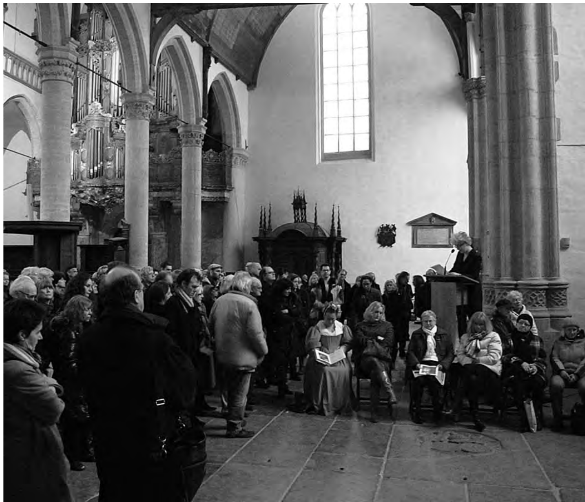
Bezoekers van het zonne-ontbijt in de Oude Kerk