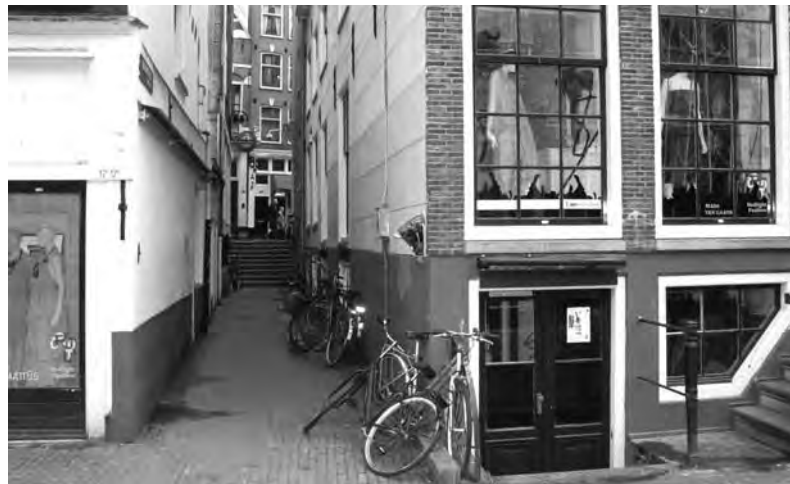
Een nieuw bestemmingsplan is in de maak

Om bepaalde functies te verminderen of tegen te gaan heeft men gekozen voor het model van de straatgerichte aanpak. Hierbij wordt de straat aangewezen waar men die vermindering wil zien en een verbetering wil bewerkstelligen. Dit biedt duidelijkheid en zekerheid aan betrokkenen, waardoor men weet waar men aan toe is. Het biedt planologisch en juridisch de beste mogelijkheden, het maakt beter toezicht mogelijk en het trekt investeerders aan. De vergadering toonde zich zeer tevreden over de plannen.