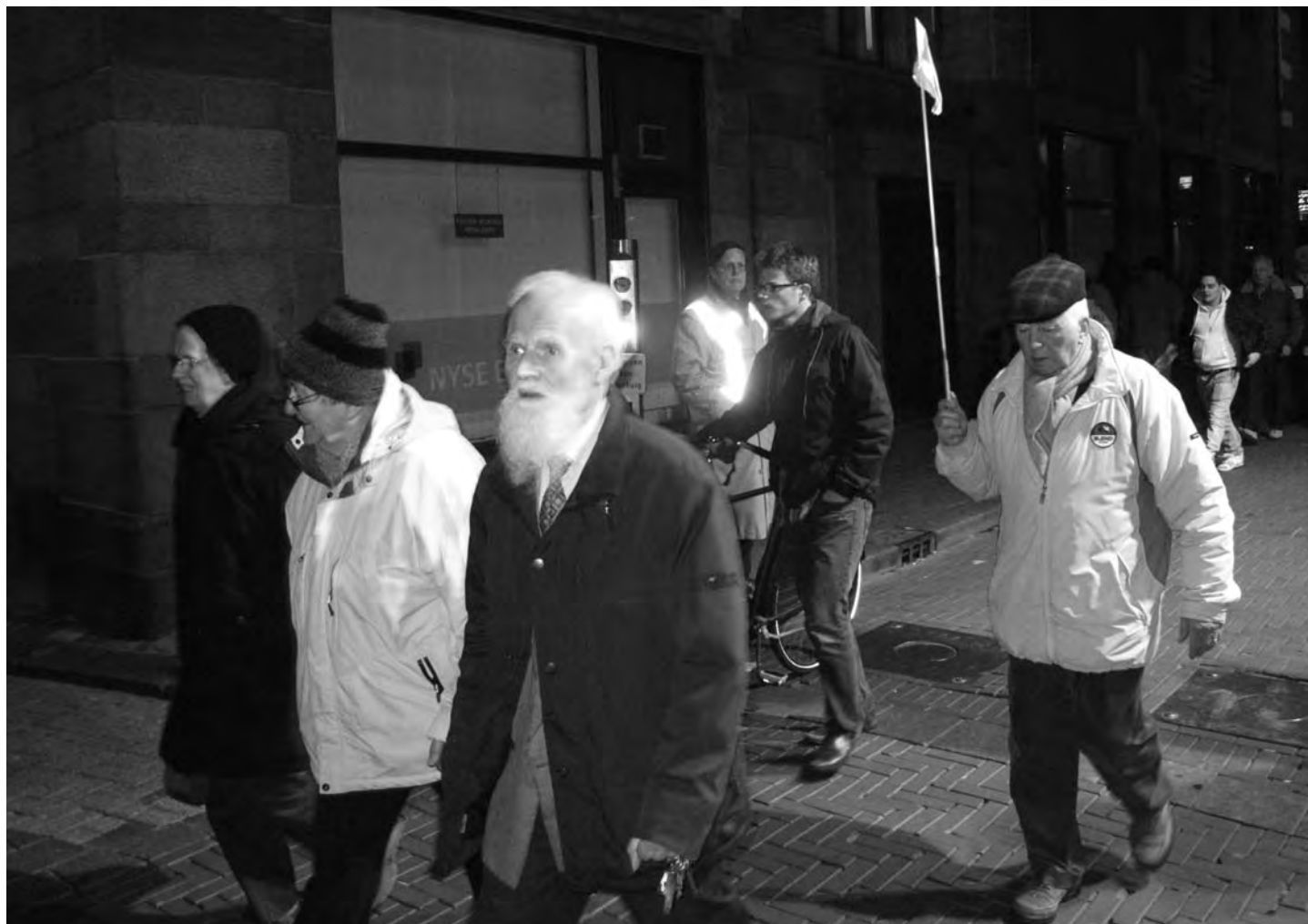
Uit alle katholieke windstreken van het land

Elk jaar op de tweede zaterdag in maart wordt de Stille Omgang gelopen, voor een deel door onze buurt. Na jaren van afnemende belangstelling, gaan er tegenwoordig weer duizenden op pad om het mirakel te herdenken dat plaatsvond op 15 maart 1345 toen een zieke man een hostie uitbraakte die maar niet wilde verbranden. Een stille tocht te midden van feestgedruis.