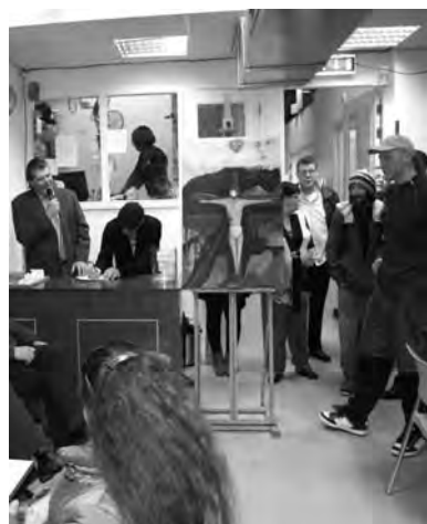
Veiling van de kunstwerken

Een belangrijk onderdeel van de dagbesteding en de aanpak is tegenwoordig, dat veel zaken door de bezoekers zelf worden gedaan. Zo koken ze zelf, waardoor ze tegen een kleine vergoeding een warme maaltijd kunnen krijgen. Verder gebeurt het schoonmaken door bezoekers zelf, evenals het onderhoud