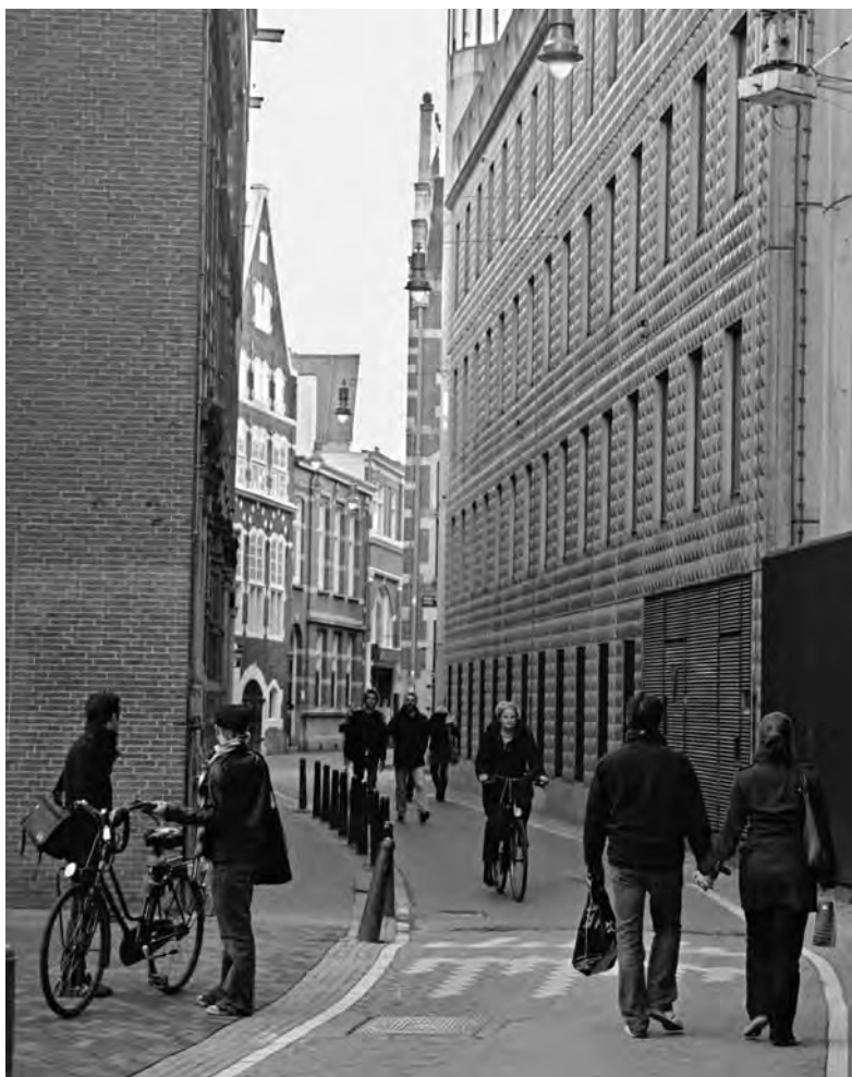
"Overdag is het een dooie straat"

Maar aan de zogenaamde rode loper van de stad, vlakbij het metrostation Rokin, zal NRC Handelsblad toch meer in het oog lopen. En iedereen van buiten de stad weet hoe snel je 'verAmsterdamst'. Kortom: wordt NRC de Nieuwe Amsterdamse Courant, voorheen het Algemeen Handelsblad? In deze of andere bewoordingen zal er in ieder geval over worden gediscussieerd in de zomer van 2013 op het terras van het nieuwe theaterhotel aan het Nesplein.