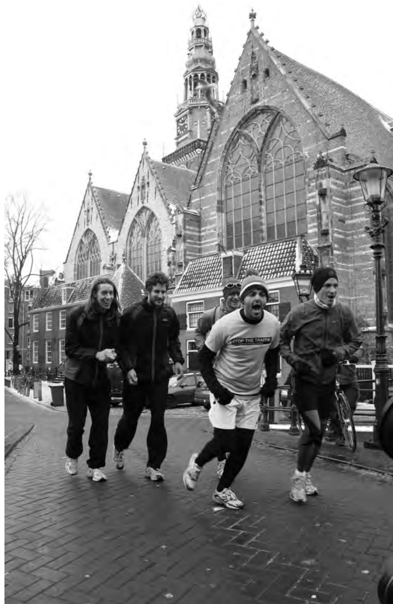
Eerste helling, over Oudezijds Voorburgwal...

De eerste etappe van de door club Stop the Traffik georganiseerde loop voert naar Den Haag. De dag daarna gingen ze naar Hoek van Holland. Na de oversteek volgden nog drie dagen hardlopen door het Engelse heuvelland. Bij de start was al zesduizend euro opgehaald. De lopers hebben hun eindbestemming gehaald en enkele tienduizenden euro's opgehaald. Hoeveel precies is op het moment van het ter perse gaan van de krant nog niet duidelijk.