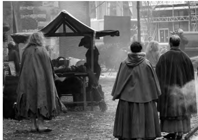
De laatste draaidag voor de EO-film Rembrandt en ik, die in januari op televisie verschijnt, zorgde voor mooie beelden bij de Oude Kerk...

Ymere ondersteunt graag initiatieven het samen leven in een wijk te bevorderen. Daarvoor werkt de corporatie nauw samen met politiek, welzijn, scholen, ondernemers, creatieven en uiteraard met bewoners zelf, zoals bij de Betere Buurtprijs. Want in een wijk moet het volgens Ymere niet alleen goed wonen zijn, maar vooral ook goed leven.