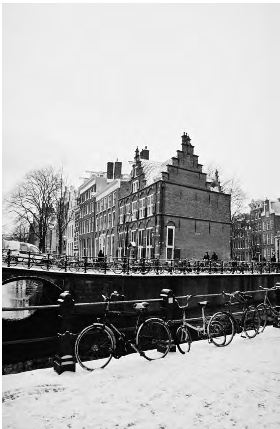
Huis aan de Drie Grachten...