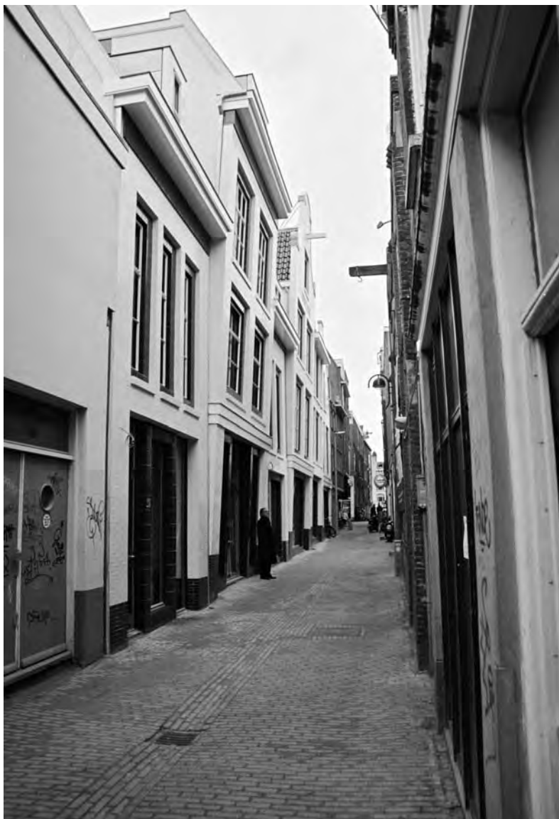
KLM-huisjes, vroeger het ARM-cluster genoemd...

De eigendomsverhoudingen in het ARM-cluster, zoals het blok werd aangeduid, lagen echter zo ingewikkeld dat Bouwfonds zich uit het project terugtrok. Van het hele plan werd uiteindelijk - na het vertrek van De Volharding - maar een klein deel uitgevoerd door de firma Sikking. Een groot aantal vervallen monumenten aan de Oudezijds Voorburgwal, de bebouwing aan de Oudezijds Armsteeg en het Veilinghuisje op het binnenterrein bleven buiten het plan.