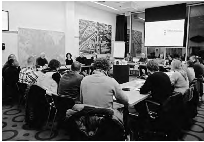
Ibo geïrriteerd over verzoek om voorstellen...

Tijdens de laatste vergadering van het Integraal Burgwallenoverleg (Ibo) is tumult ontstaan over de aanpak van het prostitutiebeleid door de gemeente. Al jarenlang, zo niet decennia, proberen betrokkenen in het Burgwallengebied de gemeente met concrete voorstellen en suggesties aan te geven hoe het beter kan. Nu kwam de vertegenwoordiger van de gemeente plotseling niet verder dan het verzoek om suggesties te doen, liefst per email.