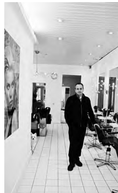
Abdel-Nour wil meer allure...

Zie ook www.theatredecoiffure.nl . De zaak is geopend op maandag en woensdag tot en met zaterdag van half tien tot half zeven. Op zaterdag van tien tot vijf.