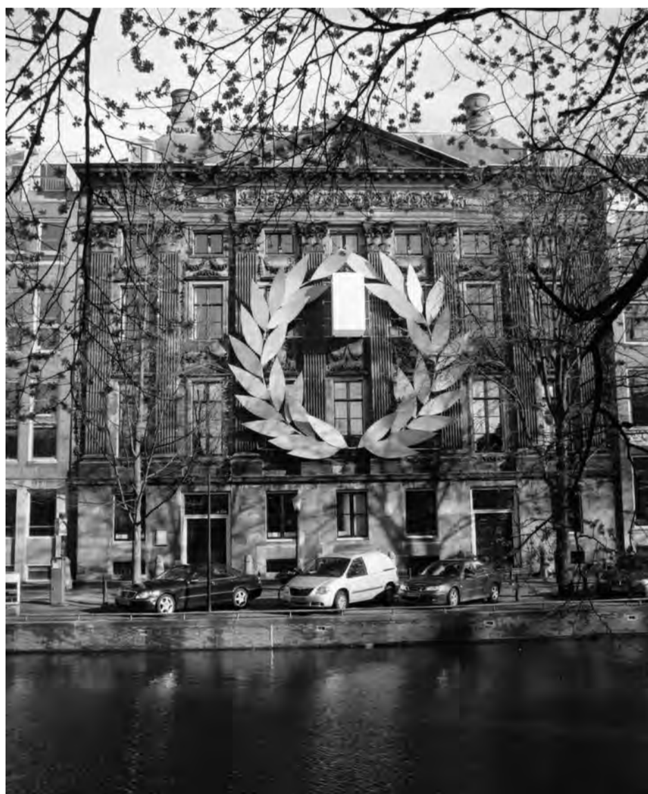
Jubileumjaar voor KNAW...

Tegelijk worden zaken die vroeger magisch waren, opeens werkelijkheid. Waren het vroeger alleen heksen die konden vliegen, tegenwoordig staat het vliegtuig klaar voor iedereen. Wat onzichtbaar was - virussen, zwarte gaten, radiogolven - wordt zichtbaar en vanzelfsprekend, en de toepassing van nieuwe wetenschappelijke kennis levert toepassingen die vroeger voor magie zouden zijn gehouden. Wetenschap onttovert de wereld, en geeft steeds nieuwe betoveringen terug. Ontdek het zelf in zgn. magicclips, hoogtepunten uit de KNAW-collecties, te zien op de jubileumsite.