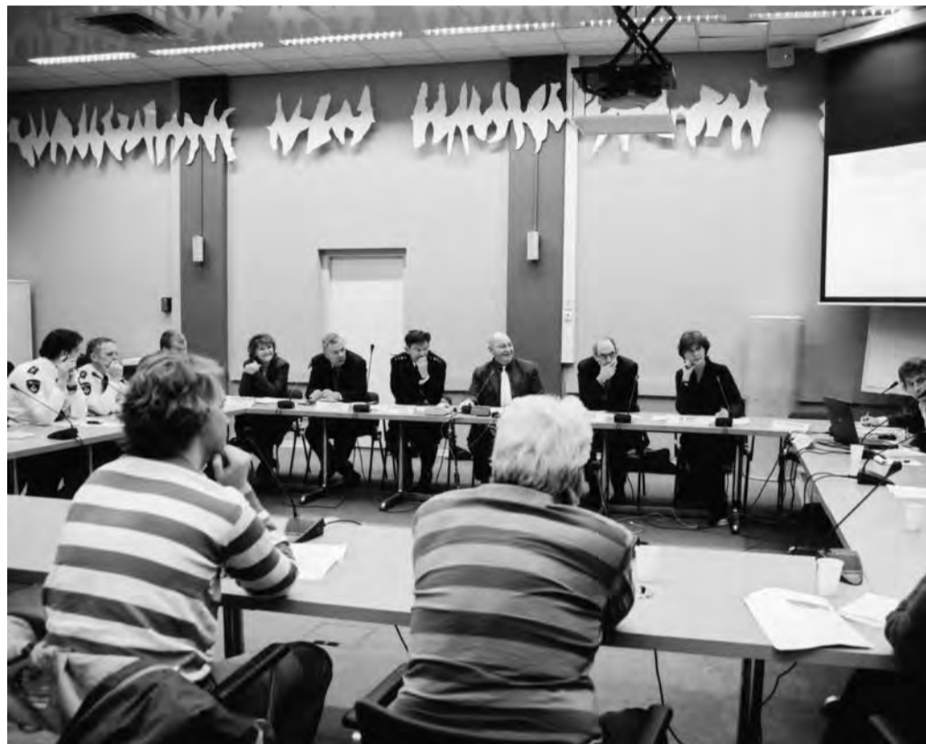
Presentatie van de plannen aan de vertegenwoordigers van de buurt...

Voor sommigen zijn de gemeentelijke plannen met het Burgwallengebied als het ware uit de lucht komen vallen. Zelfs in sommige persreacties komt een beeld naar voren, alsof burgemeester Job Cohen en wethouder Lodewijk Asscher (PvdA) op een achternamiddag een coup hebben gepleegd, met de Wallen als totaal onverwacht en zielig slachtoffer. Niets is minder waar. Een beetje ingewijde in het Wallengebied wist dat dit er ooit van zou komen. Hoogstens kan het tempo en de omvang van de ontwikkelingen mensen hebben verrast. Waar komen de plannen vandaan? En wat is de voorgeschiedenis?