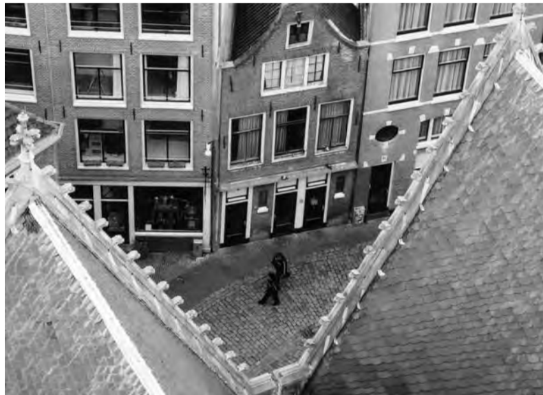
Oudekerksplein krijgt nieuwe toekomst...