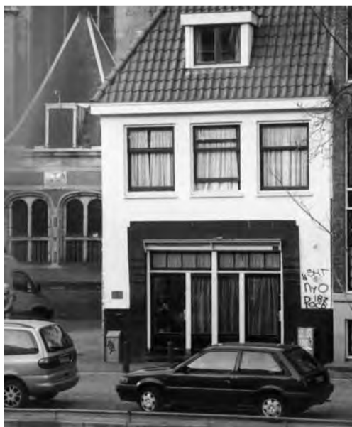
Onroerend goed aankopen...

Onverwacht? Niet echt, als men zich realiseert dat de overheid een lange adem heeft en dat ook talloze particulieren de waarde van dit gebied weten te schatten. Dan komt ooit het moment waarop nieuwe perspectieven worden geschetst en uitgevoerd.