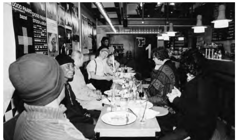
Work Force aan de maaltijd in De Blincker...

Onder het motto 'laten we nu eens tonen dat we dat echt waarderen' werd besloten de mensen van Work Force namens redactie en bezorgers van de krant een diner aan te bieden. Een rondgang met de pet leverde voldoende op