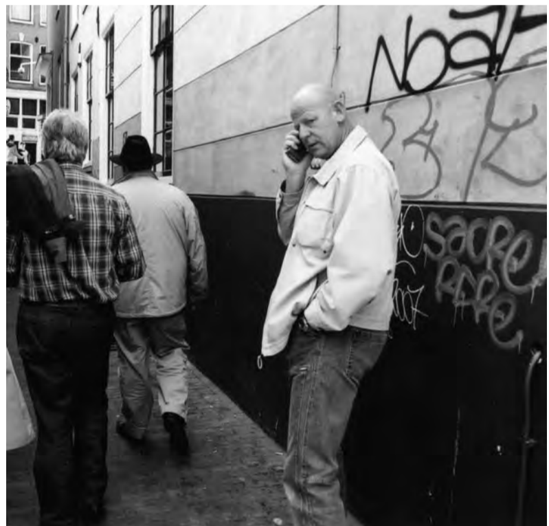
Graffiti moet nu ook eens worden aangepakt, vindt buurtvergadering...

Graffiti voorkómen is nog het allerbeste. Betrek de jongeren bij het opknappen, leg de verkoop van spuitbussen aan banden en gun kunstzinnige spuitbusartiesten hun eigen Wall of Fame. Minder belangrijk is het wie alle initiatieven neemt – de overheid, eigenaren of een samenwerkingsverband. Als het kliederen maar stopt, zodat de prachtige gevels weer kunnen pronken in schoonheid.