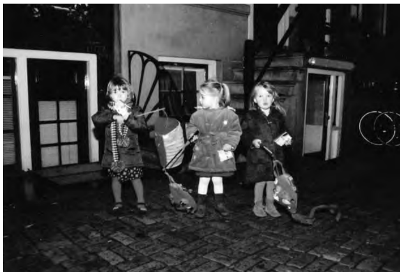
Eindelijk weer terug op de Oudezijds...

Sint Maarten bestaat ook op de Wallen. Wat in de provincie gemeengoed is, is lang niet meer gezien op de Oudezijds. Eind november verzamelden zich bijna honderd kinderen met evenveel ouders bij speeltuinvereniging De Waag.