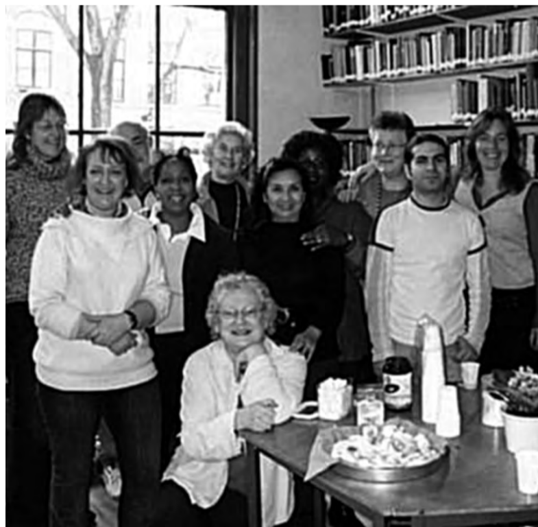
Vrijwilligers van de healingroom...

Ook in Amsterdam gebeuren er geweldige dingen: een man vertelde ons zeer recent dat toen hij in de healing room kwam, zwaar depressief en burnt out was. Hij had vier maanden op bed gelegen en al zijn lichamelijke en geestelijke reserves waren op. Ook zat zijn