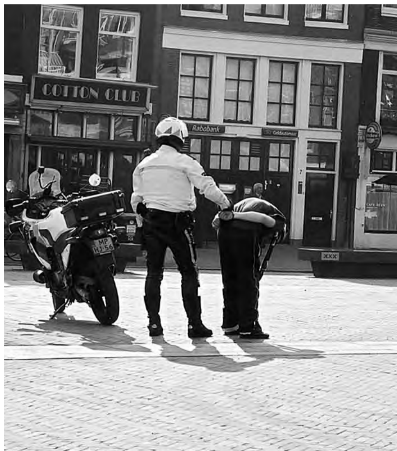
Optreden politie laatste tijd zichtbaar en merkbaar verbeterd...

Iedereen was ervan overtuigd dat de politie op straat zichtbaar actief was. Een verhoogde krachtsinspanning met merkbaar resultaat. Natuurlijk betekende dat wel overlast voor andere buurten. Zo was er net in de Plantagebuurt