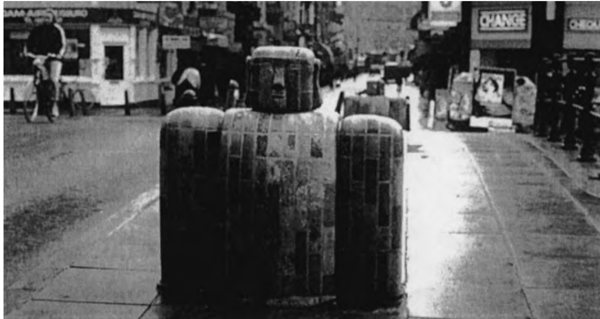
Beeld op brug over Oudezijds Voorburgwal...

Ook in en rond het Wallengebied laten de studenten zich zien: met een intocht met koetsen en vaandels, opening in de Westerkerk, receptie met 1.500 reünisten in de Beurs van Berlage, kroegjool in de eigen sociëteit en een damesdiner met 700 couverts in Krasnapolsky. Zoals altijd tonen ze ook bij dit lustrumfeest hun maatschappelijke betrokkenheid. Onlangs regelden ze al een kerstlunch voor honderdvijftig bejaarden uit de buurt en tijdens de feestweek leggen ze baropbrengsten opzij voor de bouw van een ambachtsschool in het straatarme Burkina Faso. Elke vijf jaar schenkt het studenten-corps bovendien een tastbaar cadeau aan de stad. Meestal zijn dat beelden, zoals op het Amstelveld (Kokadorus), voor het Maagdenhuis en bij de ingang van de Oudemanhuispoort. Het zijn vaak plaatsen waar studenten het nuttige met het aangename verenigen. Ook dit jaar wil de lustrumcommissie het stadsdeel verblijden met een tastbaar,