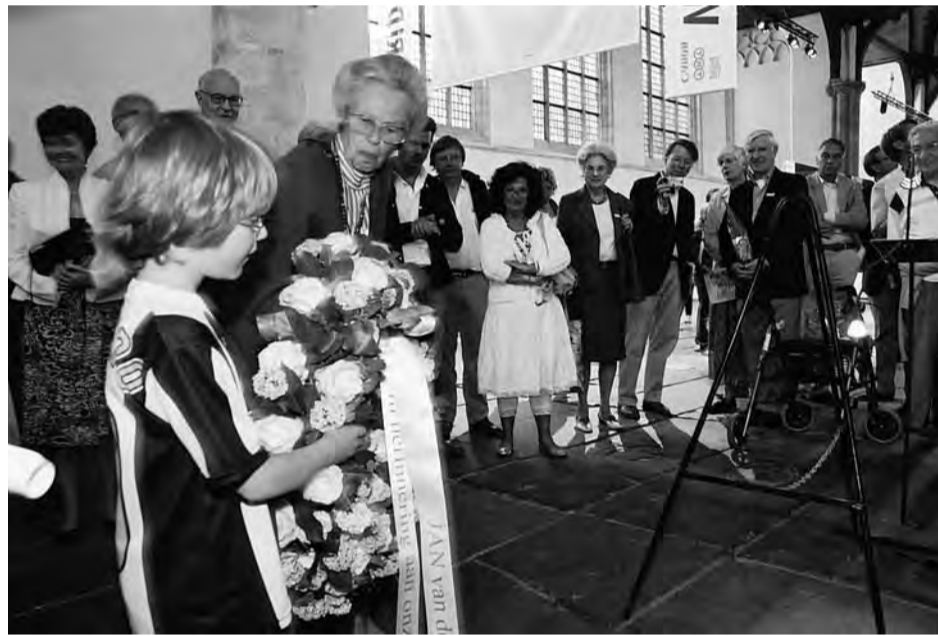
75 afstammelingen van Jan van der Heyden bezochten op 29 april 2007 het graf in de Oude Kerk...