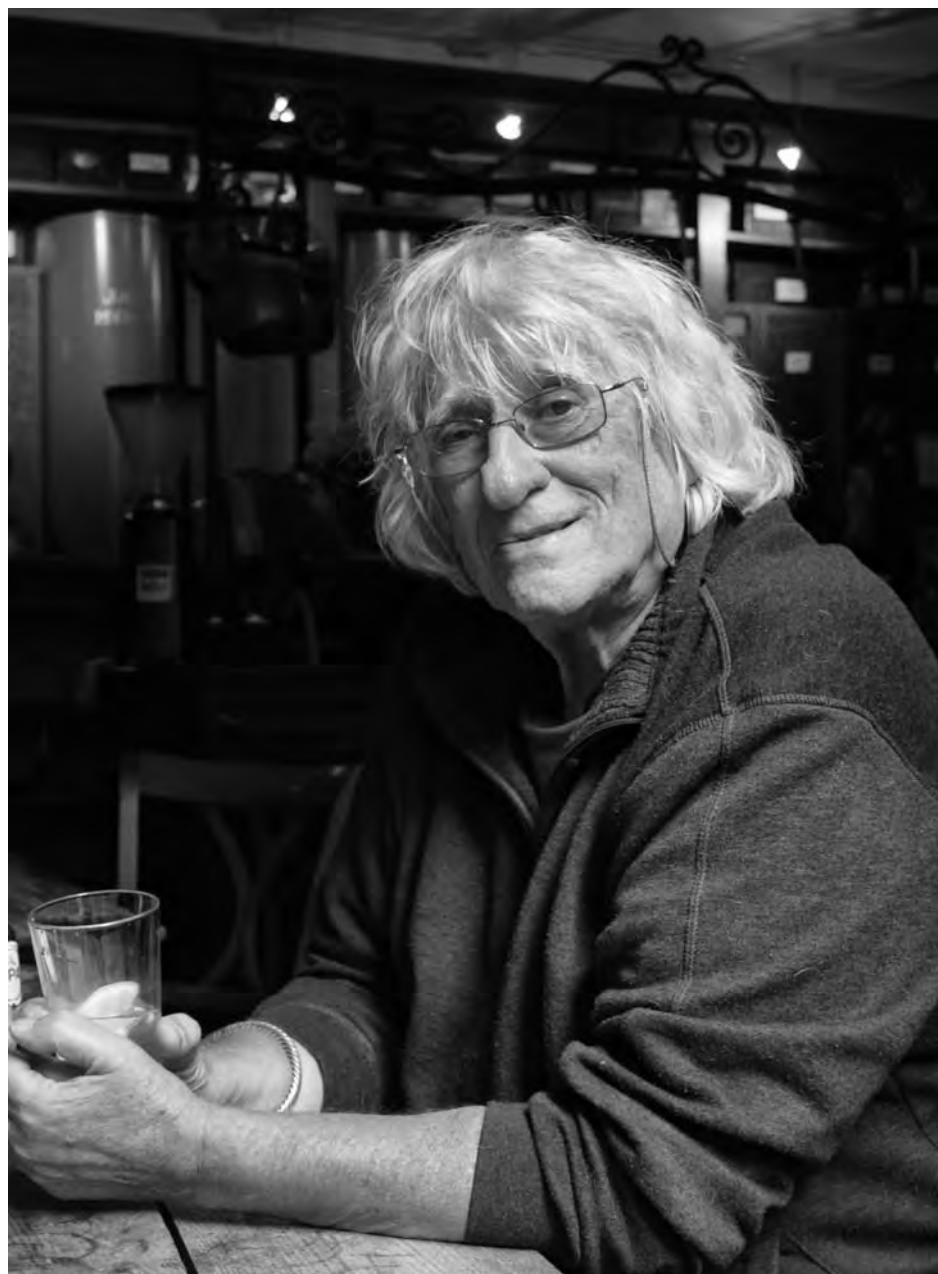
Verknocht aan de Tante Trui's en Tante Aal's

In september 1989 verhuisde hij opnieuw. Naar Brazilië dit keer. Hij kon zijn huis legaal