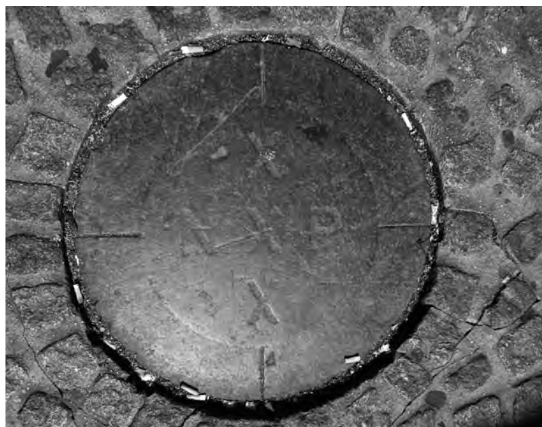
Het ijkpunt in de Dam

In het stadhuis is in 1988 op initiatief van Louis van Gasteren en Kees van der Veer een NAP-project gerealiseerd. Daarbij is ook een paal in de grond geslagen die een ijkpeilpunt heeft. Maar dit punt heeft slechts een ceremoniële en toeristische functie.