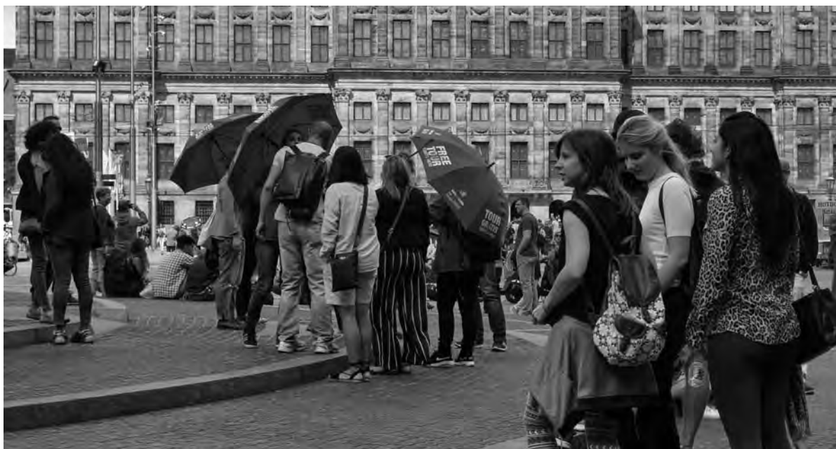
Gidsen van Sandemans werven toeristen bij het nationaal monument