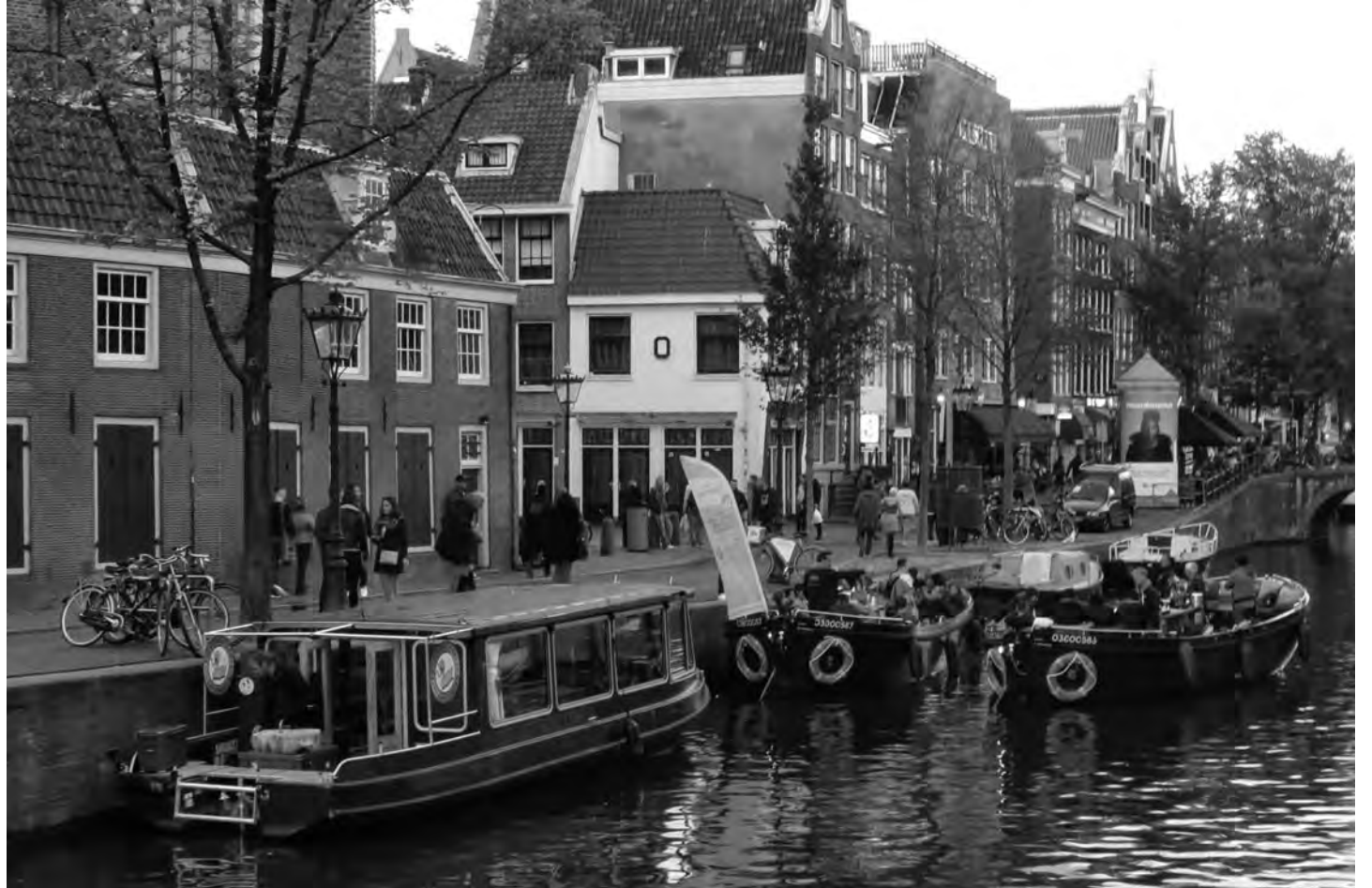
De hele dag, tot laat in de avond, varen de boten af en aan

De Oudezijds Achterburgwal is al jaren afgesloten. En de drukte op het water van de Oudezijds Voorburgwal is met het nieuwe aanbod van rondvaarten nog verder toegenomen.