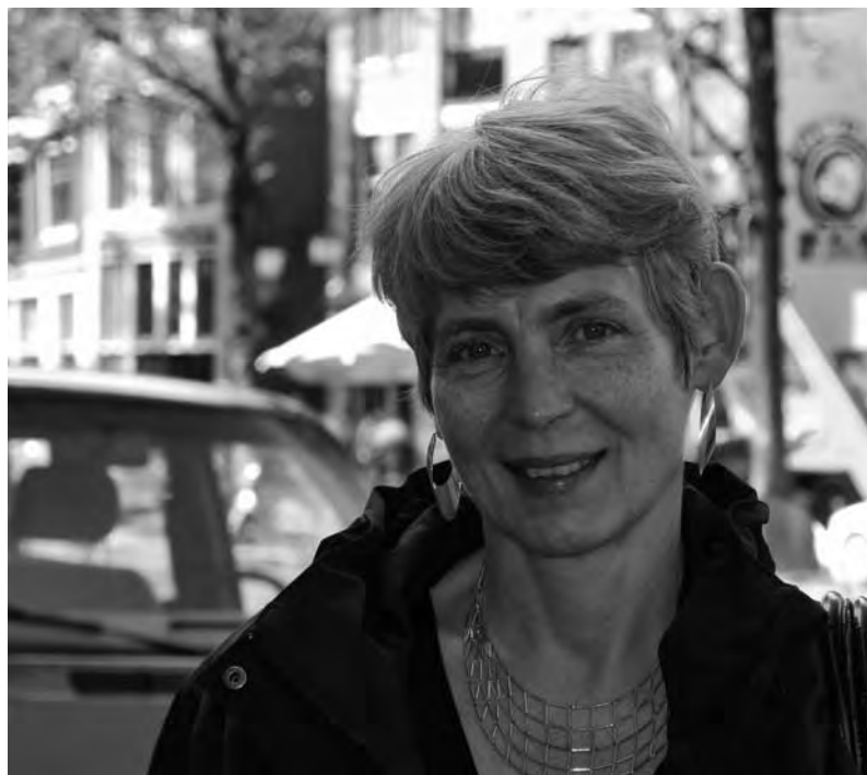
'Als alle winkels op elkaar lijken, is er niets meer aan. Voor niemand'

Er valt heus veel te mopperen en te klagen over de drukte en afgenomen leefbaarheid in het Burgwallengebied, maar regelmatig verschijnen er ook constructieve ideeën en initiatieven. Gelukkig maar, want het wordt niet vanzelf beter in de stad. Niet alles kan of moet ook 'op het stadhuis' geregeld worden. Het is goed als de bewoners en ondernemers zelf met antwoorden en plannen komen.