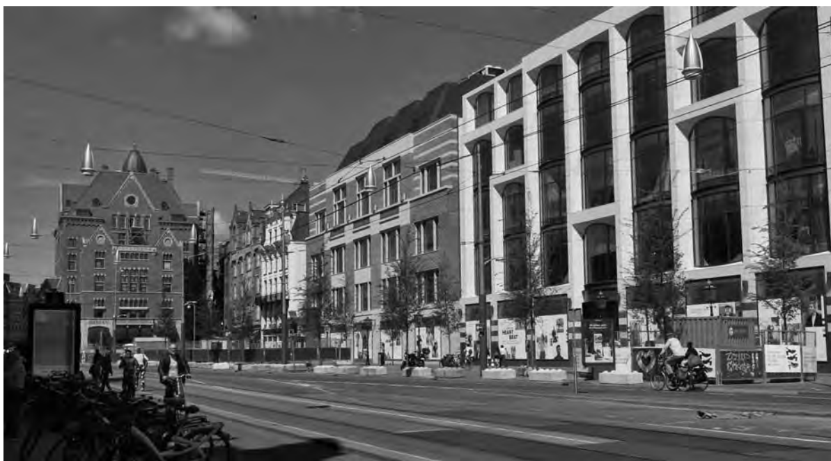
Hudson's Bay betreft maar liefst vier panden aan het Rokin

Nu de opening aanstaande is, zal moeten blijken of de zorgen van buurtbe-