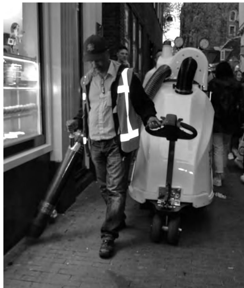
Hij slaat geen hoekje over