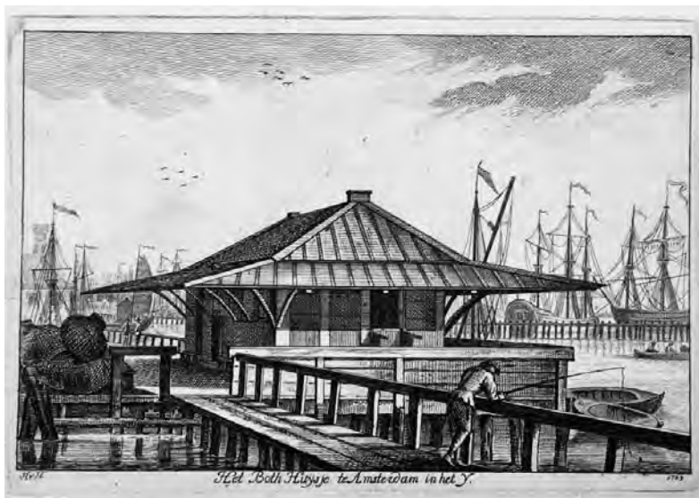
Een zeldzame prent van het Bothuysje

In 1873 werden de Nieuwe Stadsherberg en het Bothuysje tegelijkertijd gesloopt, om plaats te maken voor het huidige Stationseiland.