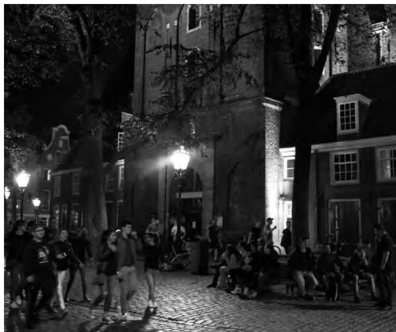
Bezoekers veroorzaken veel geluidsoverlast in de nachtelijke uren

te lichten' zijn zogenaamde grondspots . Die zijn inmiddels geplaatst (wel twee stuks) en hebben amper iets bijgedragen aan het 'aanlichten' van de kerk, maar zijn vooral gericht op de hemel. Ook niet slecht natuurlijk bij een