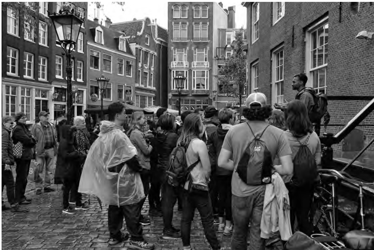
Een gids aan het werk op de stoep van de Oude Kerk

Al snel werd het duidelijk dat de belangen van de verschillende partijen ver-