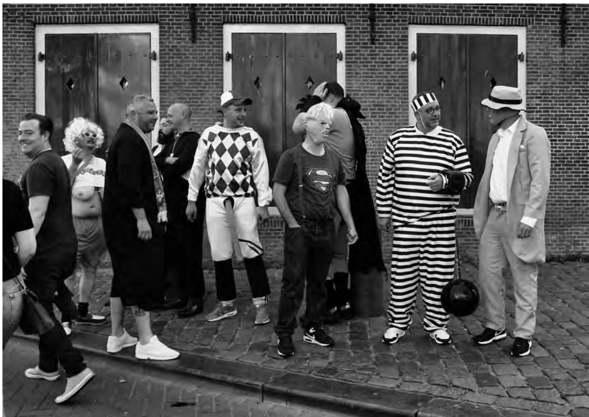
Feestvieren rond de Oude Kerk. Ongepast gedrag neemt hand over hand toe

De grootste overlastfactor neem je weg, als je zulke groepen openbare drinkebroers weet aan te pakken en als het je lukt om de verkoop van flessen en blikken drank aan banden te leggen. Als dat geen taak voor de politie is? Zet dan