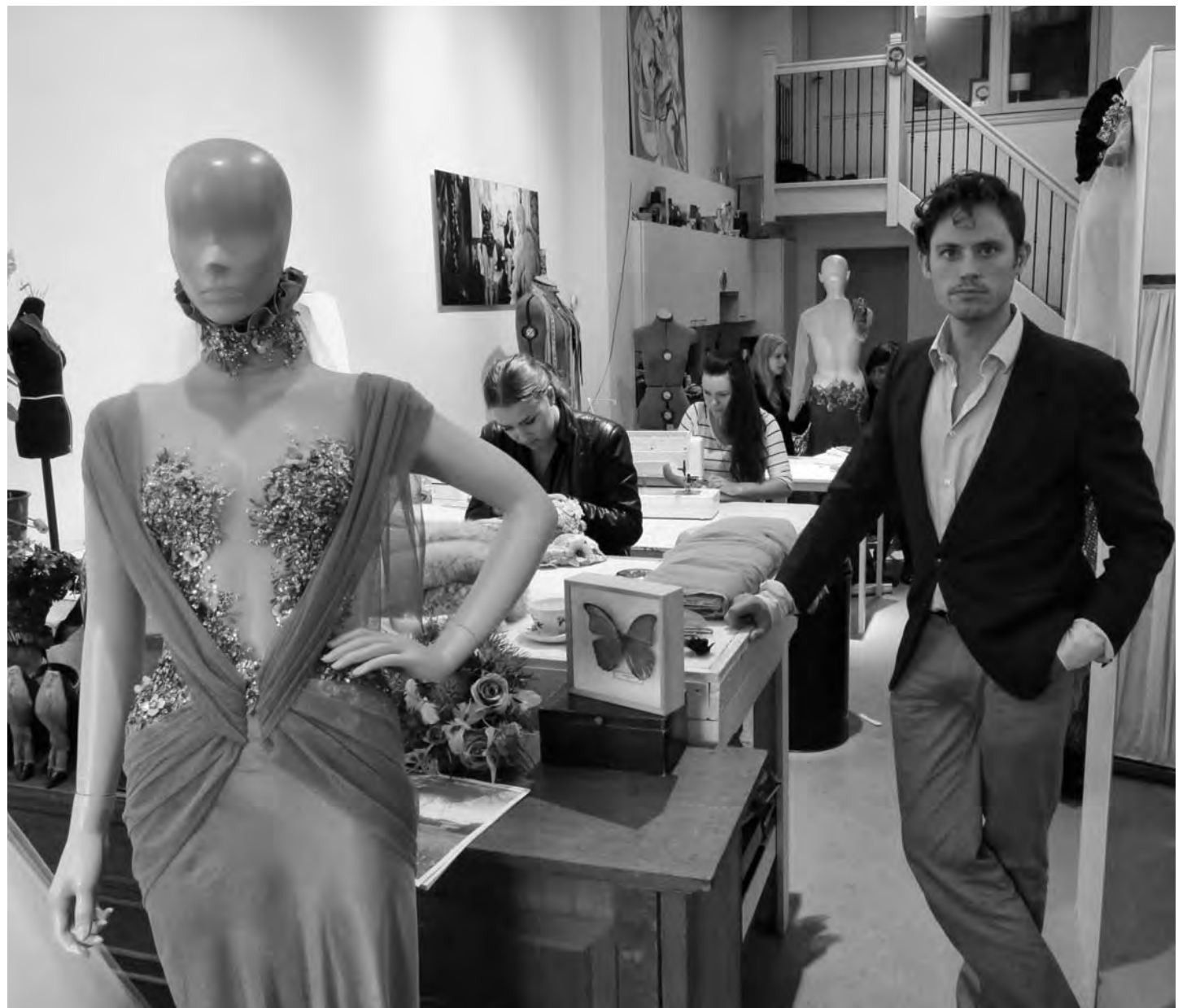
In het atelier aan de Oudezijds Voorburgwal 97

Oudshoorns roots in de buurt gaan terug naar 2008. Toen er peesmakers werden gesloten, ontstond er op de Wallen een soort kraamkamer voor jonge ontwerpers onder de naam