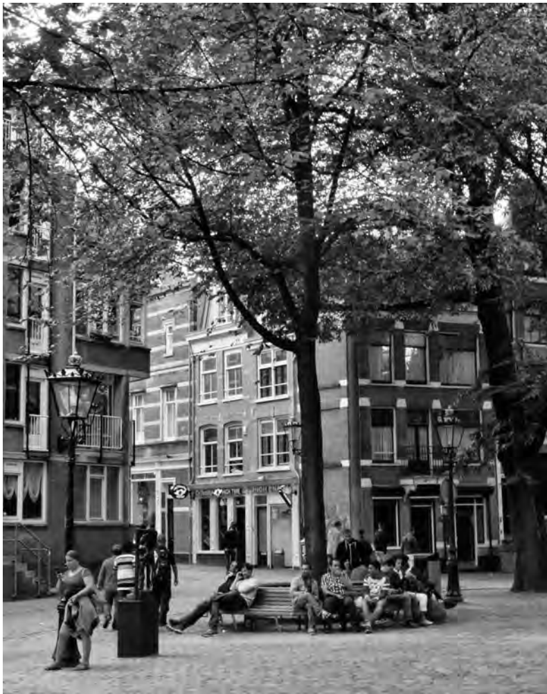
Oudekerksplein: de eerste resultaten worden zichtbaar

Nu het Coalitieproject 1012 vijf jaar loopt, wordt er door het stadsdeel een tussenbalans opgemaakt met een visie en een jaarplan voor 2014. Zowel de visie op de buurt als het jaarplan stralen een behoorlijk hoog ambitieniveau uit. Op zich verdient dat uiteraard alle lof. Bij goede voornemens is het echter altijd de vraag: kan men ze ook realiseren?