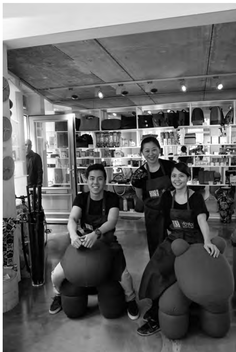
Een trendy mix van Asia Station en Yoyo! Fresh Tea Bar

Meer informatie over en foto's van het voormalige CREA-pand zijn te vinden op www.uva.nl/binnenstad