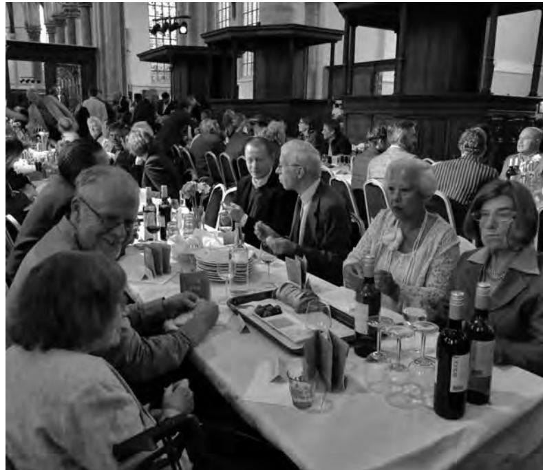
Veel oudgedienden op het restauratiefeest

Tegelijkertijd geeft ze aan dat zij in de Oude Kerk vooral zoekt naar de confrontatie tussen oud en nieuw. Eerder werd er in d'Oude Binnenstad aandacht besteed aan de verstrekkende gevolgen daarvan voor het gebouw en zijn bezoekers. Nu is de toreningang aan de