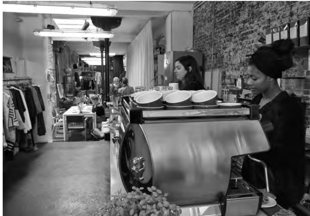
Koko Design &amp; Coffee