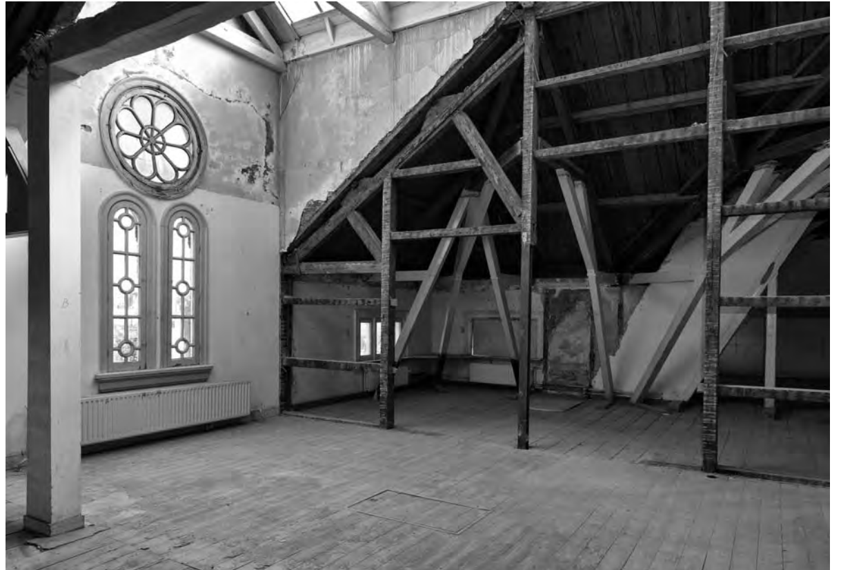
Oorspronkelijke details in het voormalige CREA-pand

Voor de panden van de toekomstige Universiteitsbibliotheek Binnenstad,