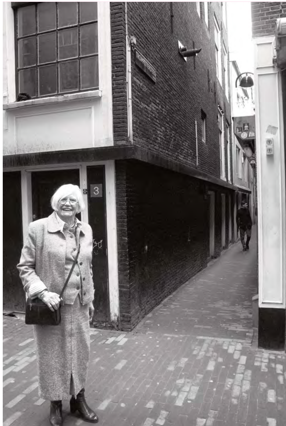
Iedereen kende elkaar

'In de Trompettersteeg kwam regelmatig een bezoeker die zijn hoogste genot bereikte als hij liggend op de grond met speelgoedtreintjes speelde en de treintjes rondom de liefst zeer hooggehakte prostitutie kon laten rijden. Allemaal waar gebeurd, hoor. We hebben wat