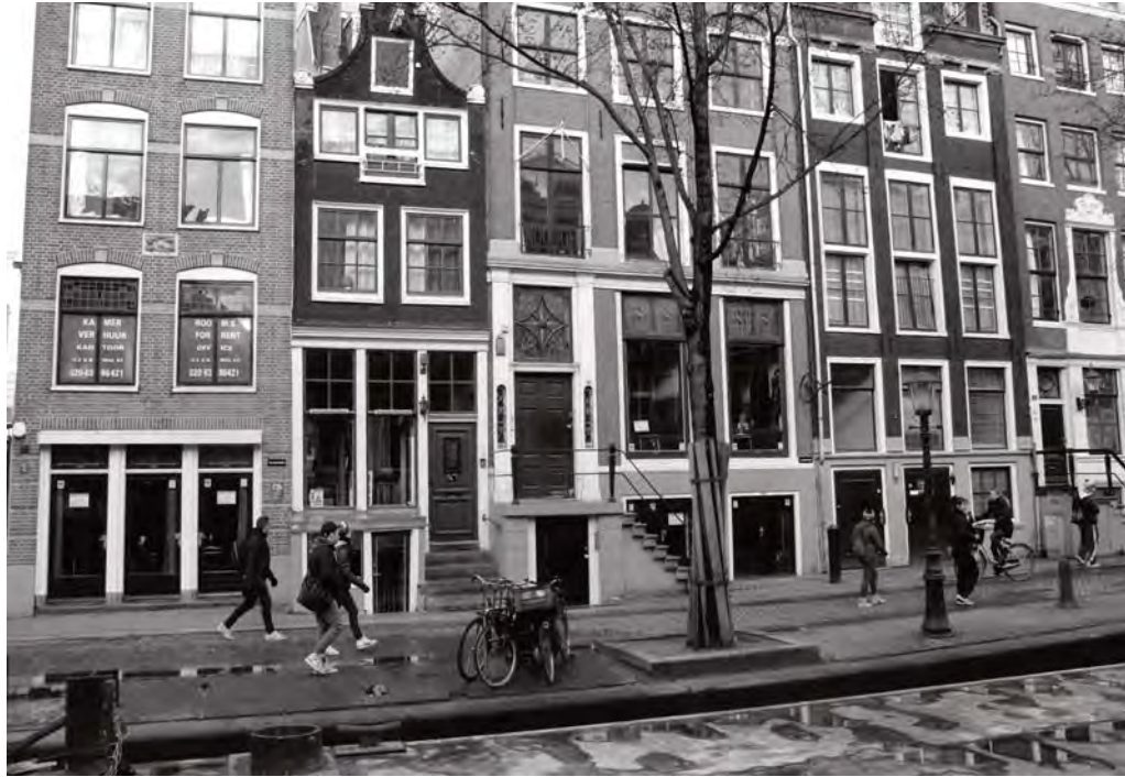
Oprichting NV Wallen is steun voor bonafide partijen

Vragen die alom de ronde doen zijn de volgende. Wie heeft de krant op het idee gebracht om op basis van voorlopige en verkeerde cijfers een verhaal te maken? Waarom is dit gepubliceerd, tégen de nodige waarschuwingen in? En wie hebben er baat bij