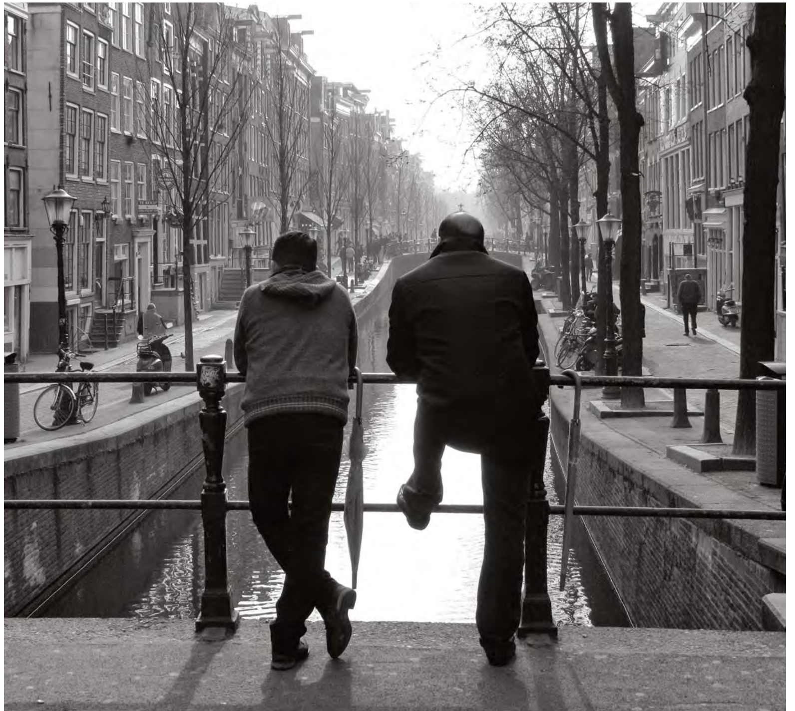
Niet werkeloos toekijken, maar vermoedens uitspreken en bij daadwerkelijke dwang 112 bellen

De oud-exploitant heeft er in zijn werkzame jaren alles aan gedaan om te voorkomen dat hij vrouwen onder dwang achter de ramen had staan. Zo werden er intensieve intakegesprekken gehouden. Bij het vermoeden dat er dwang in het spel was, werd het prostitutieteam van de politie gebeld. 'Door mijn goede contacten kwamen de politie-mensen dan voor een spontane prostitutiecontrole. Meestal waren zij ook meteen overtuigd van