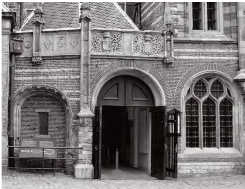
Een prachtige entree