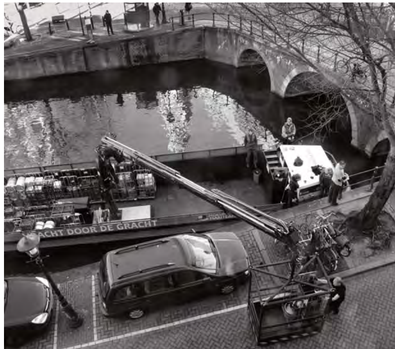
Vrachboot: schone distributie

www.centrum.amsterdam.nl Volg stadsdeel Centrum op Twitter: @020centrum en op onze Facebookpagina: Stadsdeel Centrum Amsterdam