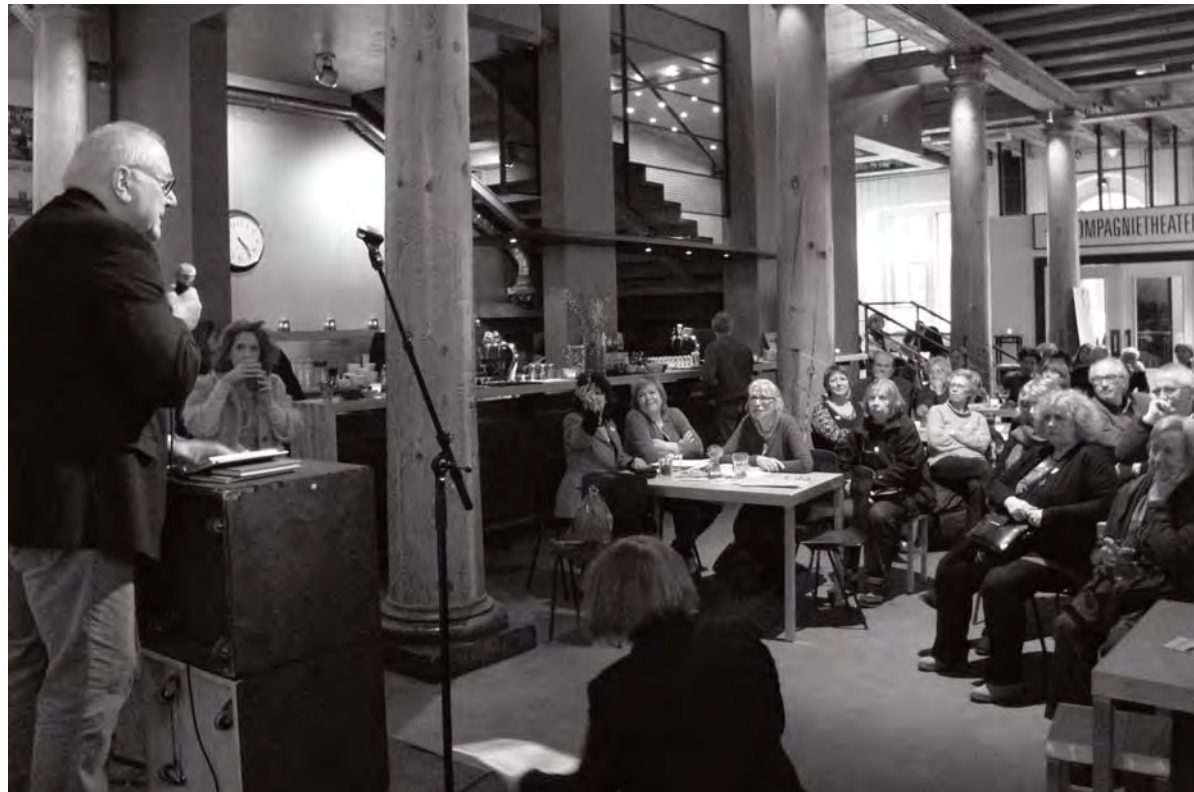
Stadsdorp in het Compagnietheater

Ook wil men niet afhankelijk worden van allerlei instanties zoals zorgverzekeraars en zorginstellingen. 'Mensen willen gewoon de regie over hun leven in eigen hand houden, zelfredzaam zijn en zo lang mogelijk zelfstandig thuis blijven wonen. Door mee te doen aan het stadsdorp kunnen buurtgenoten elkaar helpen om dat voor elkaar te krij-