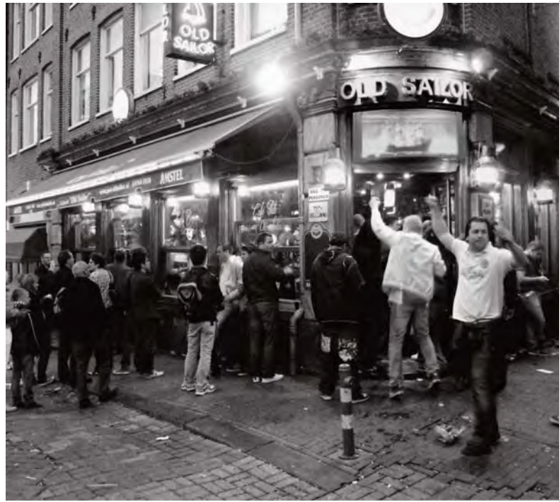
Alle remmen los

Bewoners vragen al tijden om een serieuze aanpak van de overheid, gemeente en politie, en nu ziet het er naar uit dat die in aantocht is. De burgemeester kondigde aan dat er binnenkort gestart wordt met combiteams van handhavers van gemeente/stadsdeel en de politie, die gaan optreden tegen lawaaischoppers en betrokken horecazaken. Strafrechtelijk en bestuursrechtelijk, met