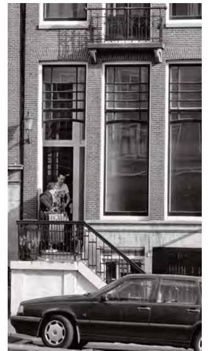
Verhuurders: 'Niet open doen als er wordt gebeld'

brandveiligheid en bestemmingsplan, hun collega's op woningonttrekking. Met een extra budget van 140.000 euro voor dit jaar wil het stadsdeel 200 adressen onderzoeken. 'De resultaten van de vorige actie zijn nog niet zodanig dat we achterover kunnen leunen', aldus de woordvoerder.