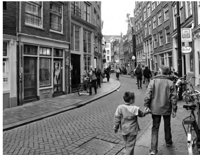
Amsterdams is hier nog steeds de voertaal

Economische vooruitgang is niet alleen een kwestie van geld, aldus Alberts. 'Als NV hebben we altijd al veel aandacht besteed aan economisch-sociale aspecten. De Hartjesdagen, de Gay Pride, graffiti-beheer, het zijn maar voorbeelden van wat we ondersteunen omdat het belangrijk is voor de samenhang in de buurt en het positieve imago van de straat. Want economische vooruitgang gaat ook over samenwerking en over partijen die elkaar wat moeten gunnen. Dat geldt voor de Zeedijk en voor het hele 1012-gebied.'