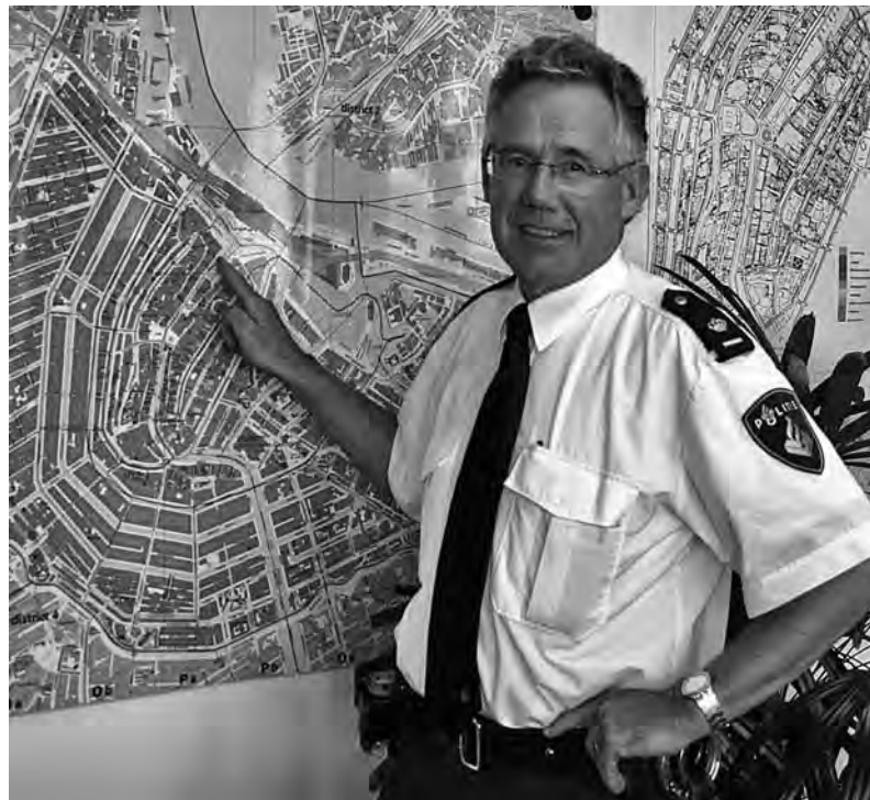
'Dit gebied zal een zeer hoge prioriteit behouden'

'Pluspunt is dat we een 24-uursbureau blijven. Dit gebied zal een zeer hoge prioriteit bij de korpsleiding behouden.' Een nieuw onderkomen voor de samengevoegde bureaus wordt nog gezocht, maar Hilgeman weet dat er aan bureau Burgwallen – waar dan ook –