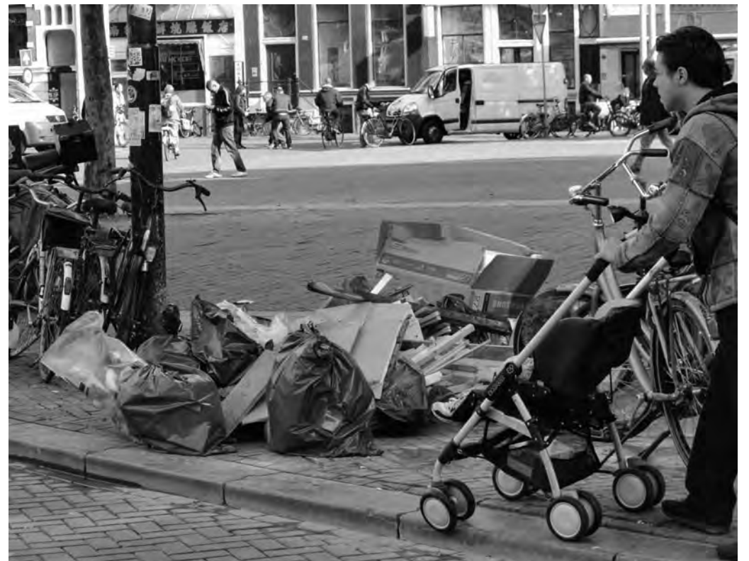
Vuilnis op de Nieuwmarkt

De oude Metselaarstoren van de Waag is verzakt, de houten schutting eromheen beklad en fietsen staan er massaal tegenaan gekwakt. Bij de boom, alweer, ligt een afvalberg. Hier komen de Gelderse kade, Zeedijk, Monnikensteeg en Bloedstraat samen. Het zijn als het ware natuurlijke aanvoerlijnen van afval.