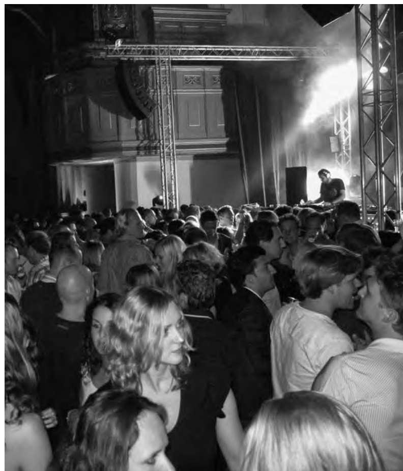
Joints opstekend onder het orgel

Zo hoort het ook in een huiskamer. Dat is weliswaar een plek voor iedereen, maar je mag er niet alles doen wat je wilt. In de huiskamer hou je rekening met elkaar; zo simpel is het.