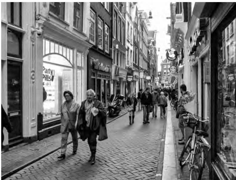
Straat in verandering

Lange tijd was de Lange Nieuwstraat een van de meest verloederde straatjes van de Amsterdamse binnenstad. Maar het tij lijkt te zijn gekeerd. Er is nieuwe kleur gekomen in deze doorgang tussen Warmoesstraat en Oudezijds Voorburgwal.