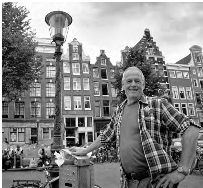
'De bagger kwam onder de deur door'

'Een huis ontruimen waarin de bewoner of bewoners zoveel spullen hebben verzameld en opgeslagen dat het wonen erin of in de omgeving ervan een gevaar oplevert voor de volksgezondheid.'