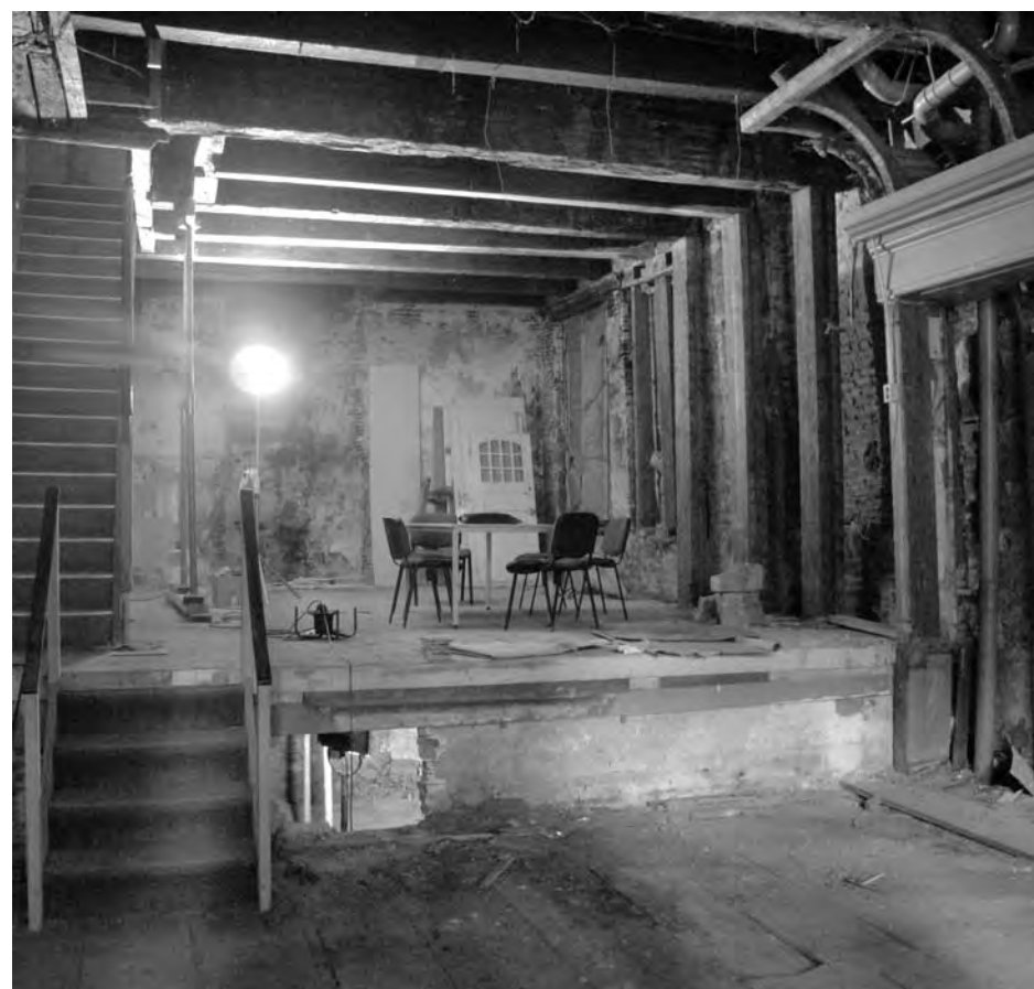
Tot op de kale muren gestript

Hertog toont ons het souterrain onder de winkelruimte, waar een compleet woonhuis tevoorschijn is gekomen, inclusief de nog goed zichtbare keuken uit de zeventiende eeuw en