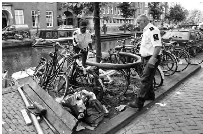
Ligt de ketting eraf? Doen de remmen het niet meer?