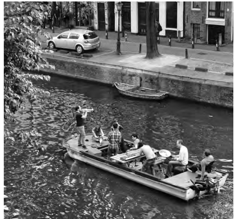
'Politie en stadsdeel weten niet hoe zwerflawaai aan te pakken'

Iedereen herkent het tafereel: een boot, volgestouwd met drinkende jonge mensen, die zich vanwege hun harde muziek alleen schreeuwend met elkaar kunnen verstaan. Hun zwerflawaai duikt ineens storend op – maar het went nooit.