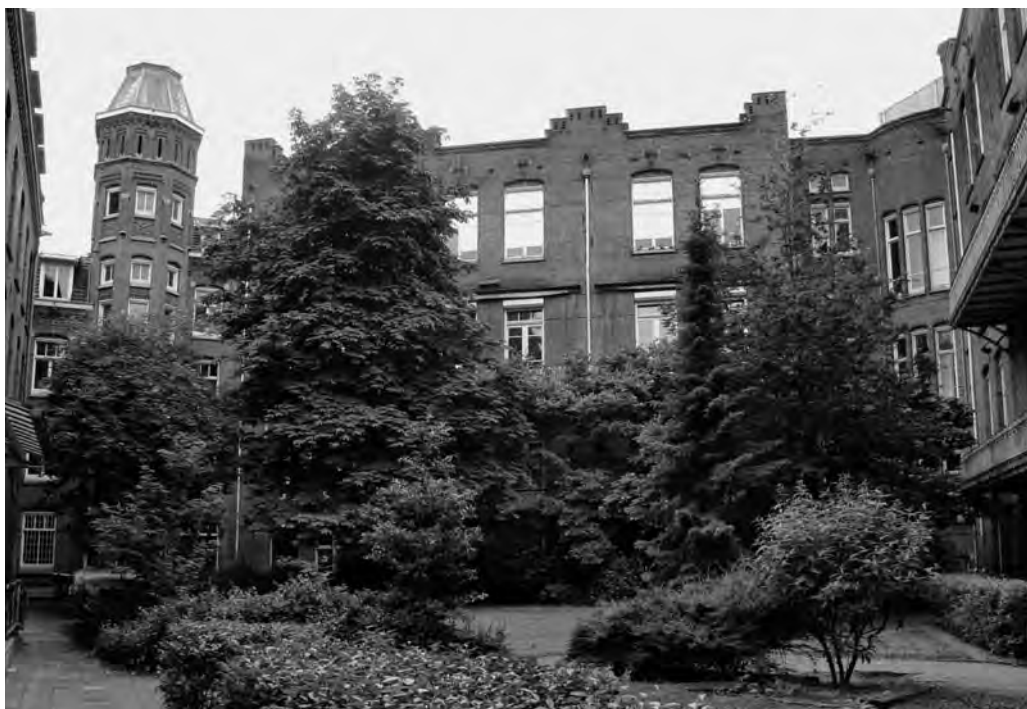
Een groene enclave

'Bij de actievoerders vormden argumenten altijd de basis van het verzet.'