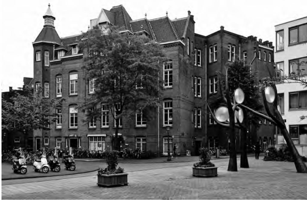
De tweede chirurgische kliniek

behoud van deze gebouwen. De stadsdeelraad maakt vervolgens een draai van sloop richting behoud en de UvA staakt uiteindelijk haar strijd om de sloopvergunning. Op deze pagina's spreken enkele hoofdrolspelers in deze vete zich uit over het verleden, maar vooral ook over de toekomst van het BG-terrein.