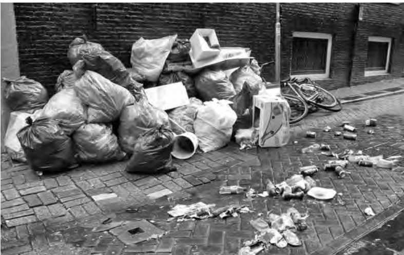
'Er zal duidelijk een hoop moeten verbeteren'

'Een vuilnisbelt voor mijn deur? Nee bedank!' zal menig bewoner desgevraagd uitroepen. Toch neemt het probleem juist in het Wallengebied toe: ontijdig (niet op afhaaldagen) aangeboden huisvuil, bedrijfsafval van winkels en horeca, matrassen van hostels. Soms lijkt het dumpen ervan eerder regel dan uitzondering. Wat valt er tegen te doen?