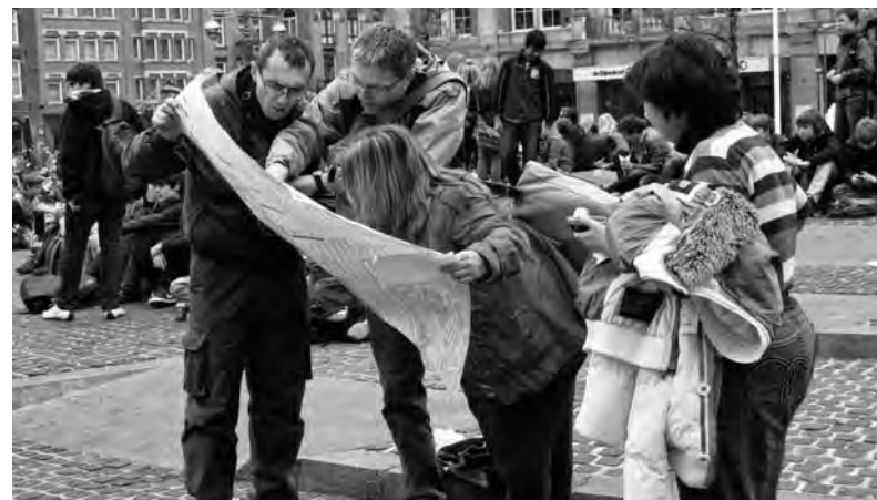
Ook dit jaar weten de toeristen de Wallen weer massaal te vinden

meestal van edelen, die ook de bouwgrond al bezitten. Pas daarna verschaft de bloeiende handel ook kapitaal aan de steden en hun burgers, waarmee in Amsterdam in 1389 het eerste klooster kan verschijnen. In 1578 telt de stad uiteindelijk op 15 duizend zielen liefst 21 kloosters, waarvan het leeuwendeel aan de Oude Zijde.