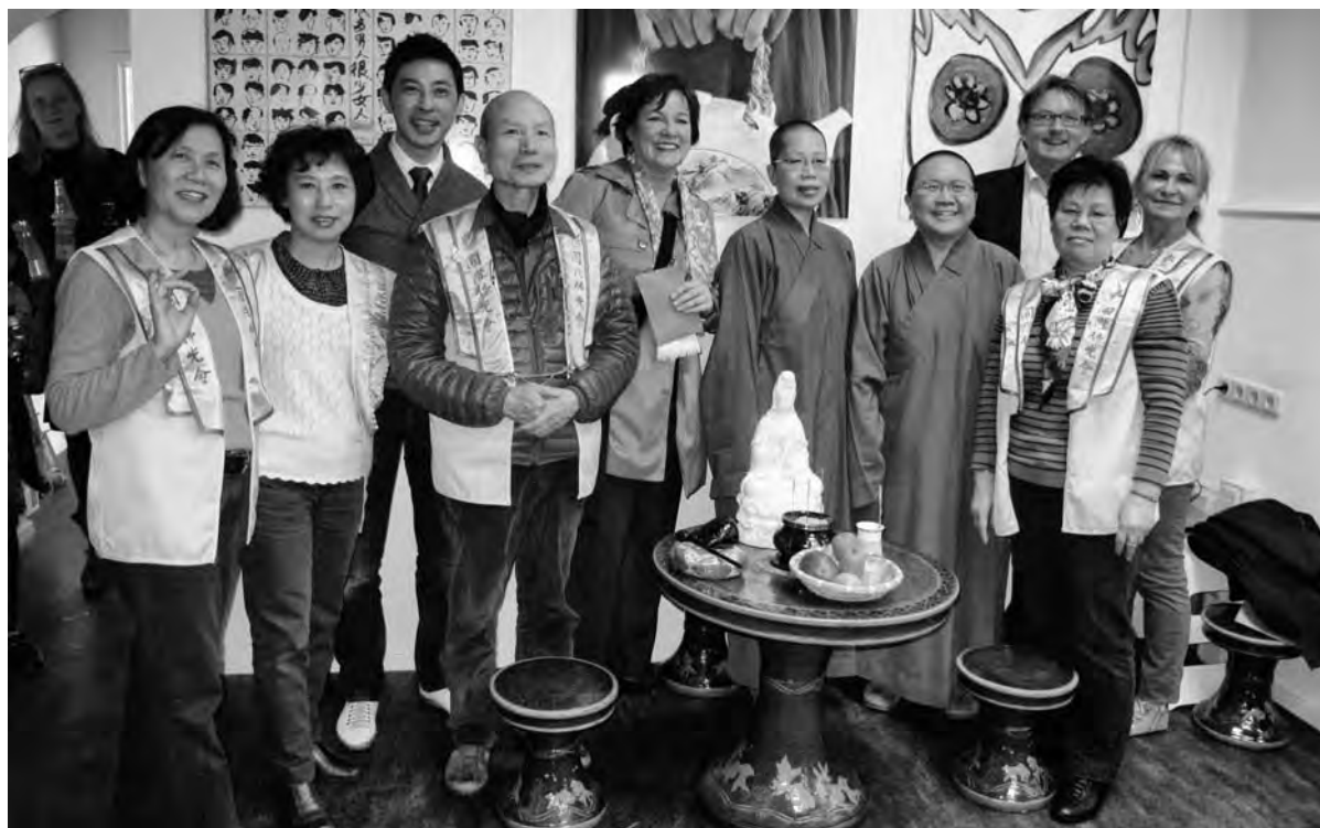
Op 12 april werd in het voormalige BIC de tentoonstelling Inspired by China geopend. De ruimte wordt nu gebruikt om een brug te slaan tussen het hedendaagse China en de Zeedijk.