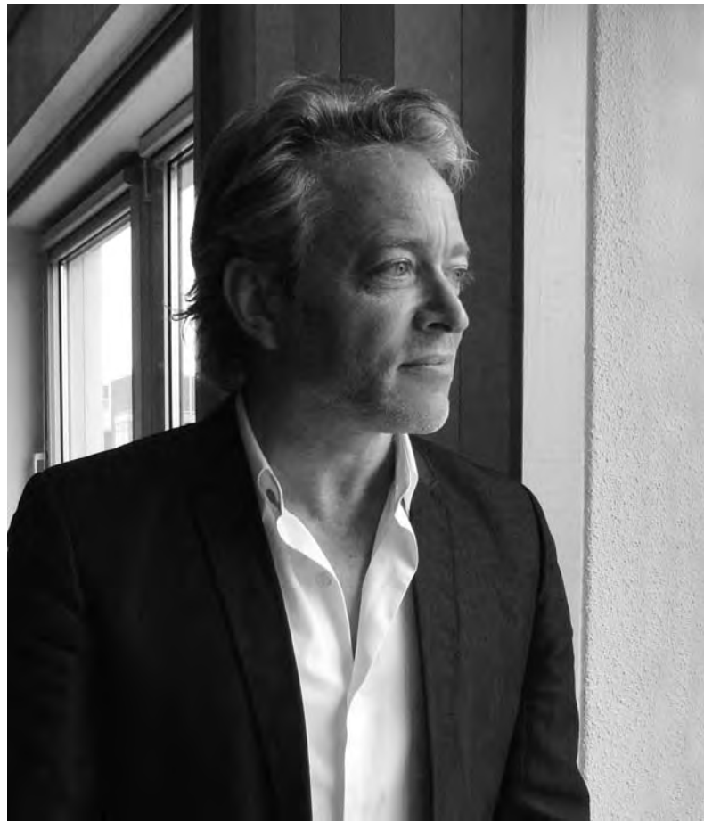
Stukje bij beetje beter

leegstand op te lossen zijn er makelaars op de wereld en dat zal gewoon even tijd kosten. Ook dit probleem is overi-