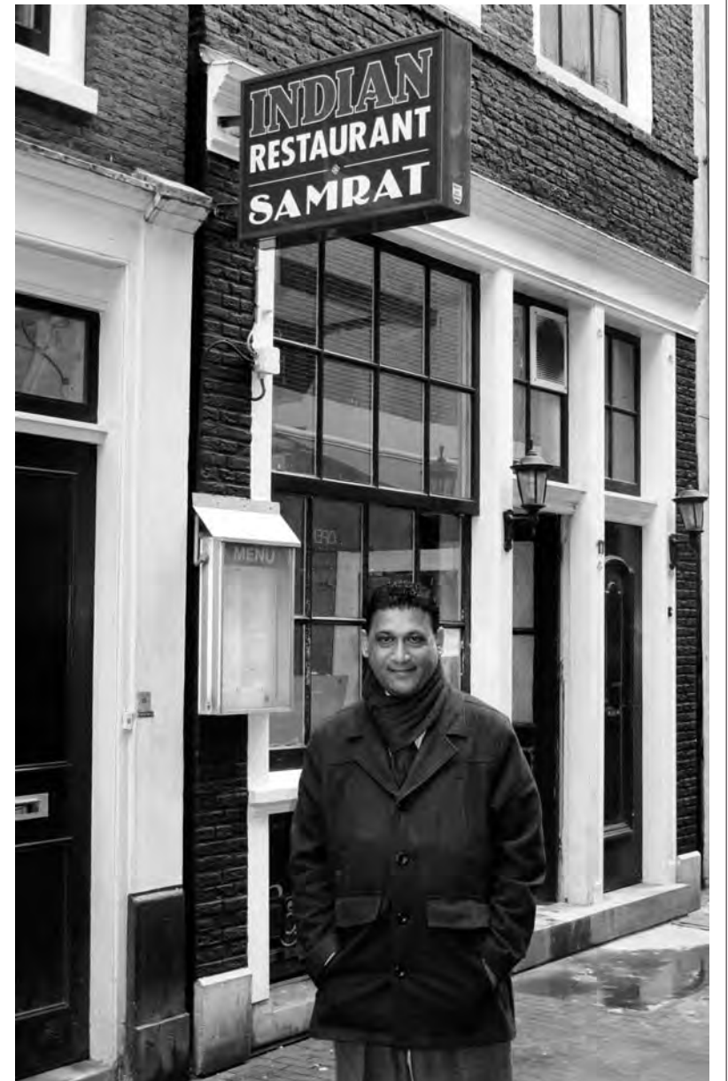
'We vragen de klanten altijd hoe ze het willen hebben'

Vanaf begin april bezorgt restaurant Samrat ook eten thuis. 'Vanaf een minimumprijs van 15 euro. Boven de 50 euro krijg je er een gratis fles huiswijn bij, maar houd er wel rekening mee dat we niet binnen een minuut kunnen bezorgen. We willen de gerechten nauwkeurig bereiden en dat vraagt tijd.' De bezorgtijden zijn van half zes 's middags tot half elf 's avonds.